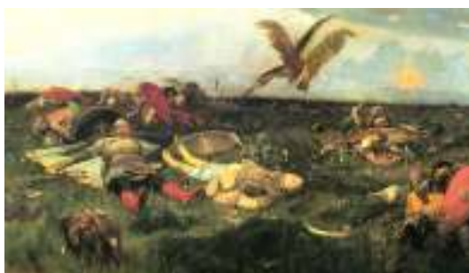
В.М.Васнецов «После побоища»