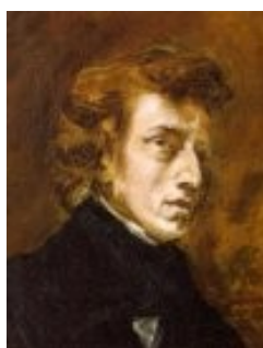
Эжен Делакруа «Фредерик Шопен»