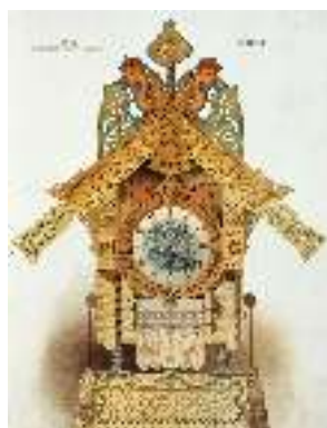
В.А.Гартман«Картинки с выставки»