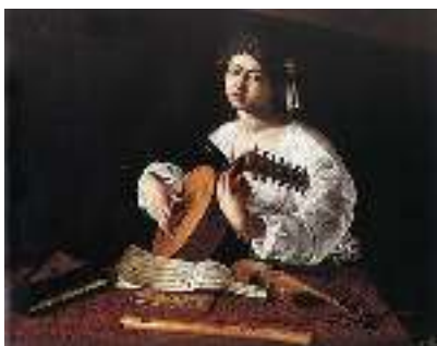
Микеланджело Караваджо «Лютнист»