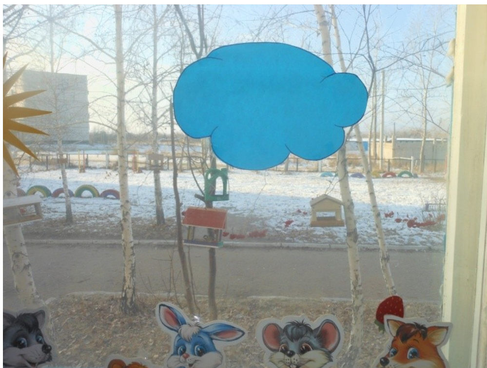
Наблюдаем за птицами из окна