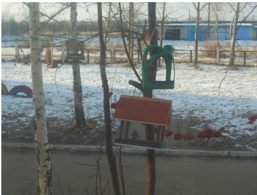
Первая синички прилетела в столовую.