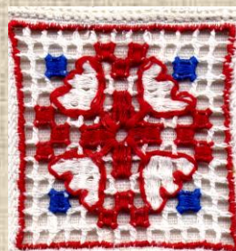
182. Фрагмент передника. Аппликация: вышивка и вышивка с точечной вышивкой