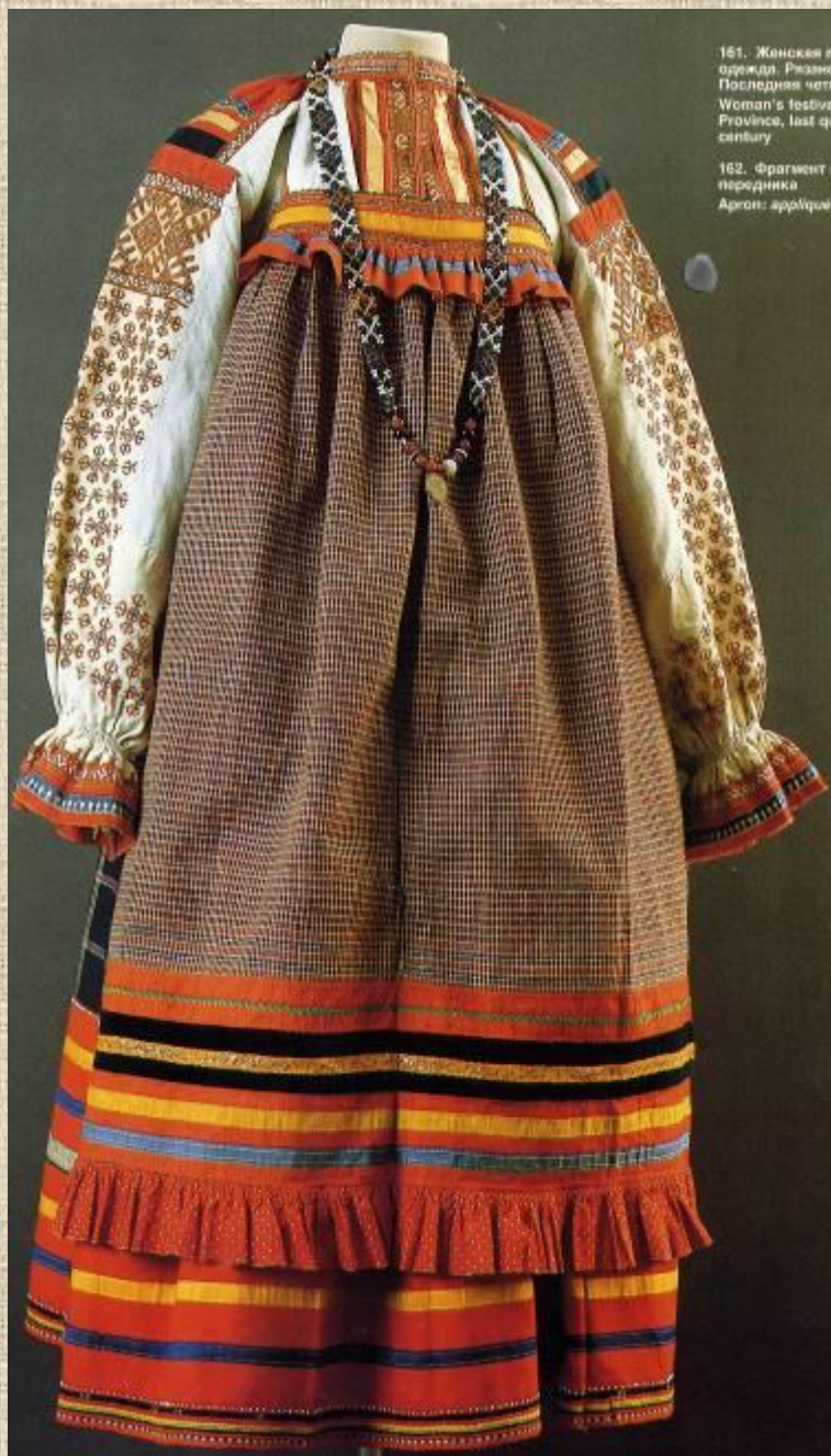
161. Женская одежда. Рязань. Последняя четв. Woman's festive Province, last qu. century