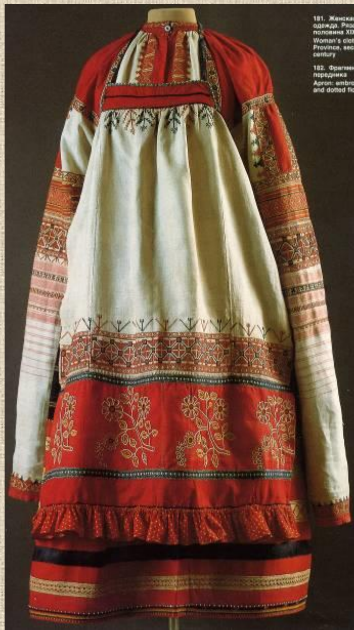
181. Женская одежда. Рязанская губерния XIX век. Woman's cloth Ryazan Province, 19th century