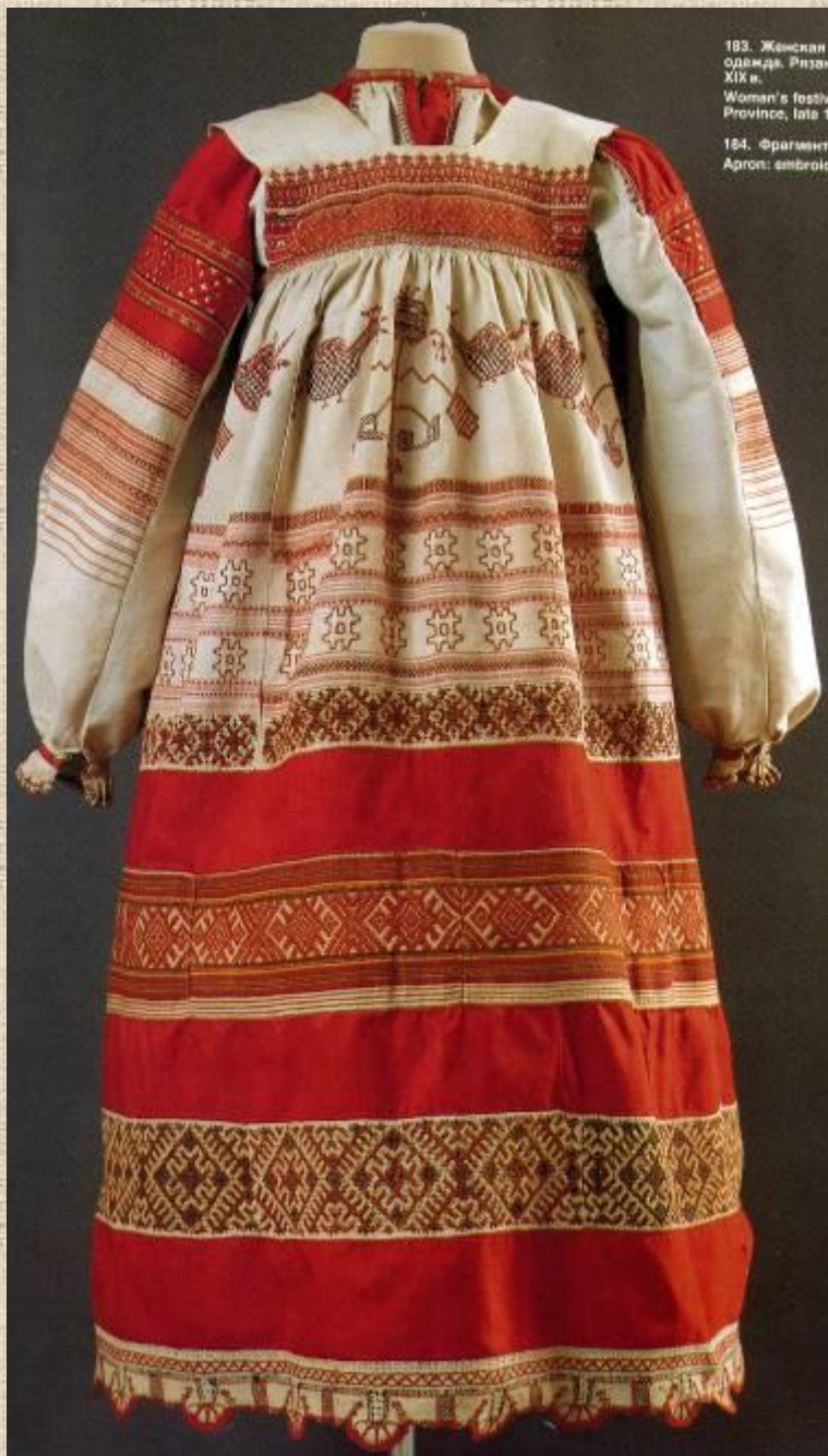
183. Женская одежда. Рязань XIX в. Woman's festive Province, late 19th cent.