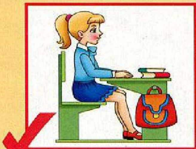
Посадка «готов к работе»