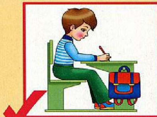
Посадка при письме