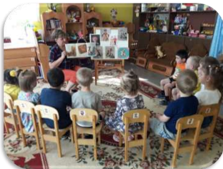
«Пёстрый хоровод» Гулыга Е.