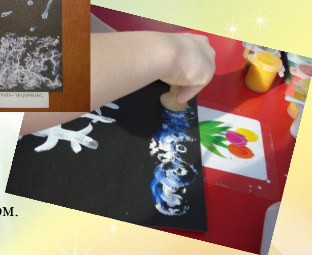
Печать пенопластом, рисование тюричком.