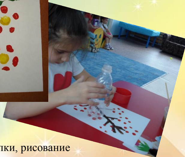
Печать дном от бутылки, рисование тычком.