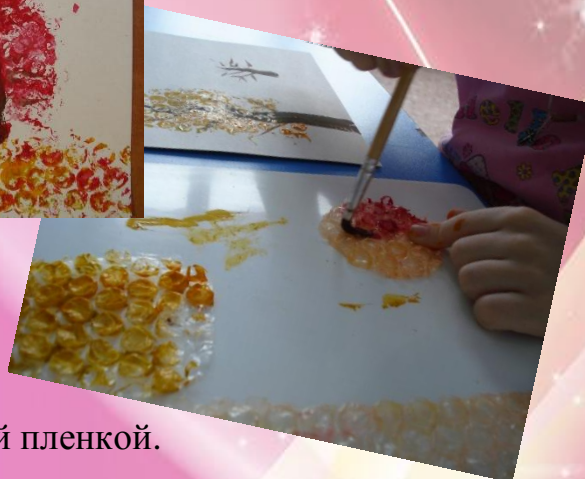
Печать пузырьчатой пленкой.