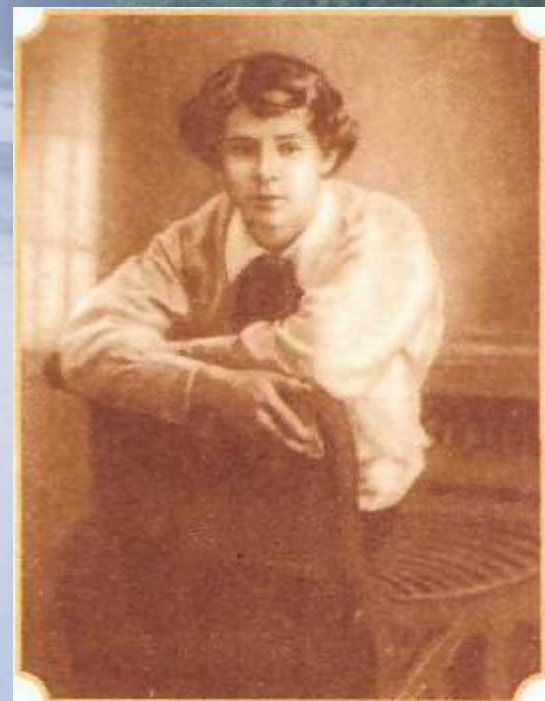
С.Есенин 1913—14 год