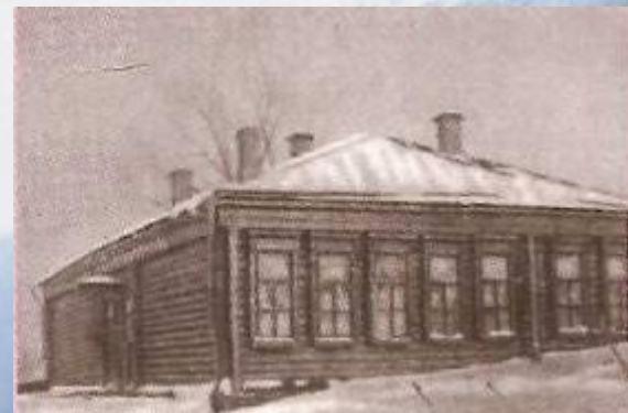
Константиновское земское училище

С.А. Есенин родился в Рязанской губернии в крестьянской семье. С 1904 по 1912 год учился в Константиновском земском училище и в Спас-Клепиковской школе. За это время им было написано более 30 стихотворений, составлен рукописный сборник «Больные думы» (1912), который он пытался опубликовать в Рязани. «Береза» - первое напечатанное стихотворение С. Есенина. С первых же стихов в поэзию Есенина входят темы родины и революции. Поэтический мир становится более сложным, многомерным, значительное место в нем начинают занимать библейские образы, христианские мотивы.