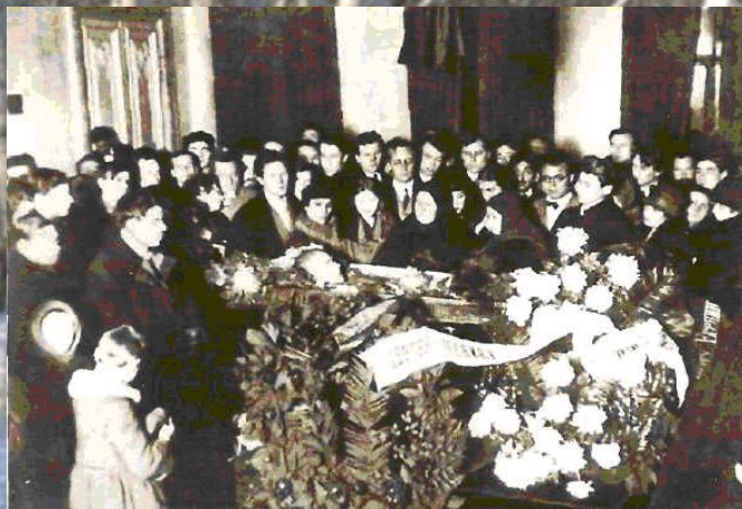
У гроба С. А. Есенина в Доме Печати. Фотография. 1925 г.

А стихи его знала, читала и пела вся Россия.