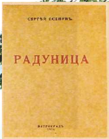
С. Есенин. Обложка. "Радунница", 1916г.

В начале 1916 года выходит первая книга «Радунница» , в которую входят стихи, написанные Есениным в 1910-1915 годах. Есенин позже признавался: «Моя лирика жива одной большой любовью, любовью к родине. Чувство родины - основное в моем творчестве». Один из основных законов мира Есенина - это всеобщий метаморфизм. Люди, животные, растения, стихии и предметы - все это, по Есенину, дети одной матери-природы. Он очеловечивает природу. Книга пропитана фольклорной поэтикой (песня, духовный стих), ее язык обнаруживает немало областных, местных слов и выражений, что тоже составляет одну из особенностей поэтического стиля Есенина.