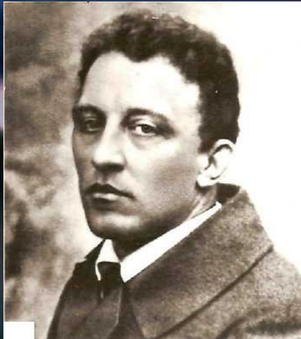
А. А. Блок Фотография. 1916

В 1915 году Есенин приезжает в Петроград, встречается с Блоком , который оценил «свежие, чистые, голосистые» стихи «талантливого крестьянского поэта-самородка», помог ему, познакомил с писателями и издателями. Осенью 1915 г. он входит в литературную группу «Краса» и литературно-художественное общество «Страда».