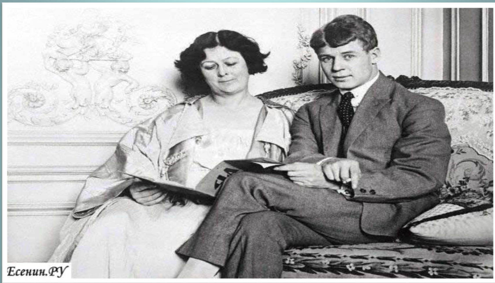
С. Есенин и А. Дункан. Берлин. 1922 г.