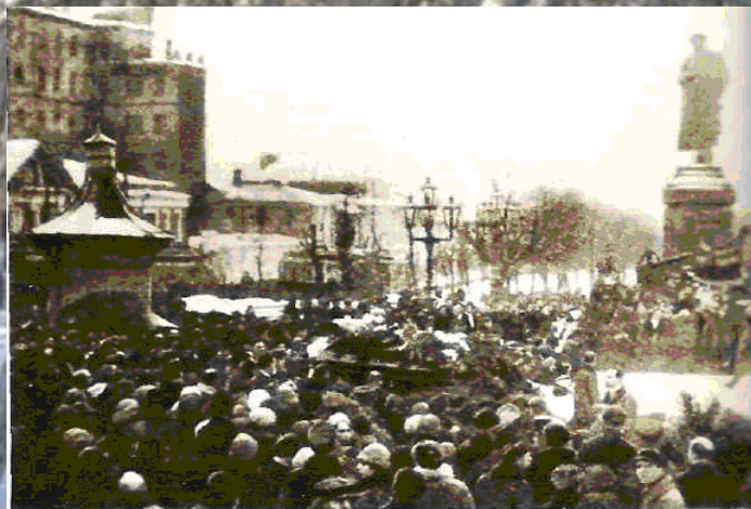
Похоронная процессия у памятника Пушкину. Москва Фотография. 1925