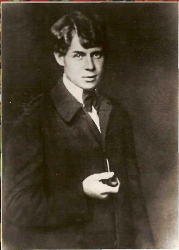
С. А. Есенин. Фотография

В ноябре 1925 года поэт закончил автобиографическую, исповедальную поэму «Черный человек», которая оказалась последней в ряду написанных им поэм, а среди них были такие значительные, как «Пугачев» (1921), «Страна негодяев» (1922-1923), «Песнь о великом походе» (1924), «Анна Снегина» (1925). Некоторое время Есенин находился в бакинской больнице водников с подозрением на воспаление легких (окончательный диагноз - туберкулез).