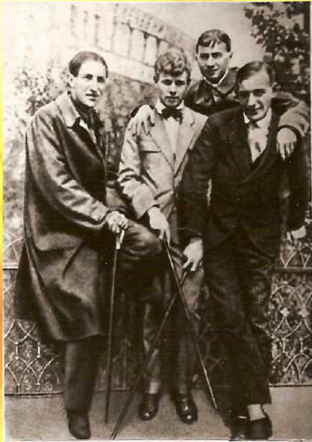
С. А. Есенин среди имажинистов. Фотография. 1922 г.