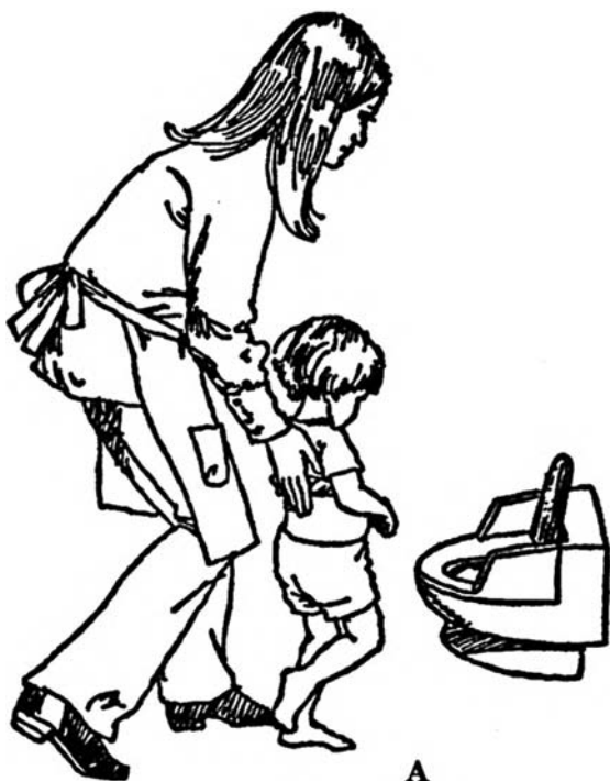
Учимся ходить на горшок после «аварии»: А. Учим ребенка быстро подходить к горшку

Ребенку следует выполнить всю последовательность шагов около десяти раз. Дважды он должен начинать с того места, где произошла «авария», чтобы переиграть ситуацию, завершив ее положительным действием. Последующие тренировки должны начинаться в самых дальних частях комнаты и даже квартиры, чтобы малыш научился приходить к горшку из любого места в вашем доме.