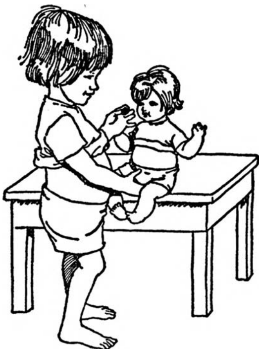
Проверяем, сухие ли у куклы трусики, хвалим ее и даем лакомство

в унитаз, поймет, что его будут хвалить за правильное хождение на горшок и выражать недовольство за мокрые трусы, а также осознает необходимость спокойно сидеть на горшке перед мочеиспусканием.