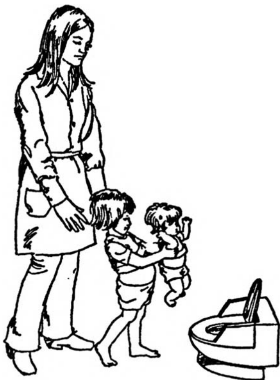
Провожаем куклу к стульчику-горшку

После того как кукла какое-то время посидела на горшке, попросите ребенка посмотреть, не начала ли она делать «пи-пи». Потом сожмите куклу, чтобы она «пописала».