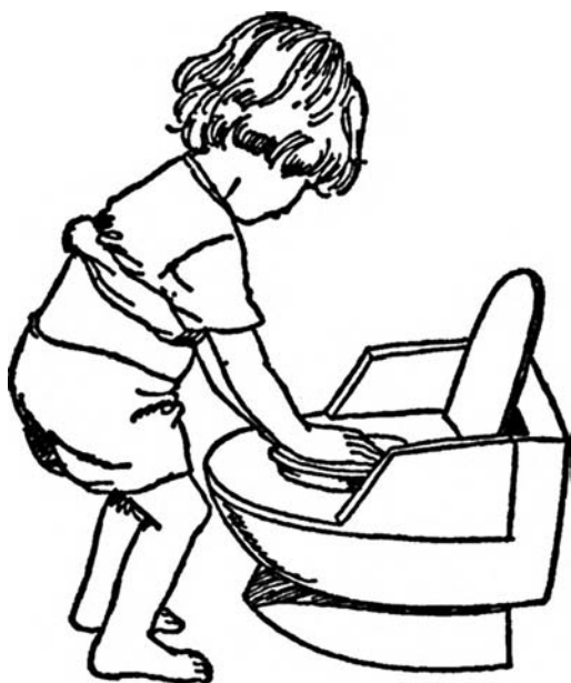
Возвращаем емкость на место

внимание малыша на том, что кукла готова «пописать, как большая девочка», и пусть он усадит ее на горшок и похвалит за успешное «пи-пи». Как и ранее, ребенок должен вылить содержимое горшка, а потом три раза с интервалом в пять минут проверить, сухие ли у куклы трусики. Таким образом, мы завершили этап обучения с помощью куклы, которая «писает, как большая».