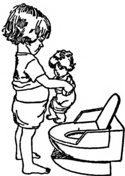
Сажаем куклу на стульчик-горшок