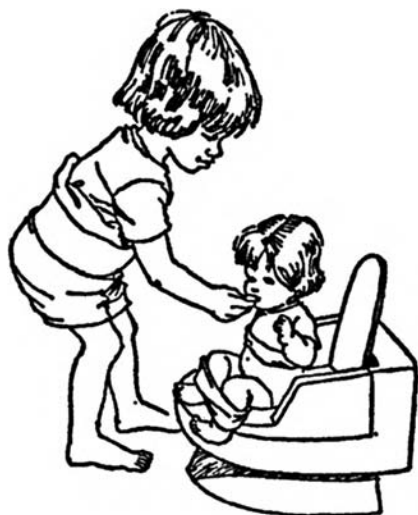
Угощаем куклу за то, что она «пописала» в горшок