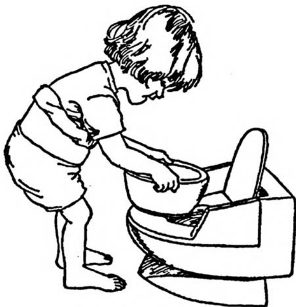
Достаем емкость из стульчика-горшка

Теперь пусть ребенок поможет кукле надеть трусики и покажет ей, как вылить «пи-пи» из горшка. Проследите за тем, чтобы малыш аккуратно достал емкость из стульчика-горшка и отнес ее в уборную. Вылив содержимое в унитаз, ребенок должен слить воду. Помогите малышу, если у него возникнут какие-то затруднения. Не позволяйте ему отставлять горшок в сторону, пока сливается вода, потому что от волнения он, скорее всего, про него забудет. Потом попросите ребенка отнести емкость на место. Вы должны постоянно находиться рядом с малышом и следить за тем, чтобы содержимое горшка не проливалось на пол.