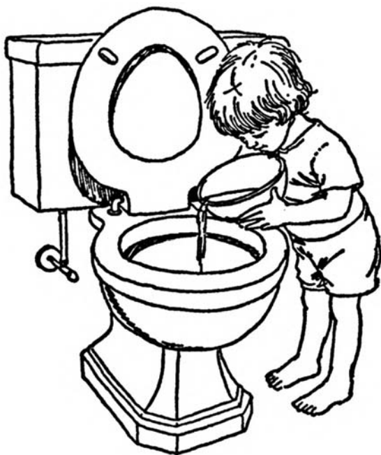
Выливаем содержимое горшка в унитаз

те малыша выразить свое недовольство тем, что она «написала» в штанишки: «Нет, Долли, большие девочки не мочат трусики». Если малыш этого не сказал, спросите его, указывая на куклу, ребенок ли это. Он должен кивнуть. Затем предложите малышу научить куклу «ходить на горшок». Заметьте также, что тренировки позволят ей запомнить, где она должна делать «пи-пи». Помогите ребенку отнести куклу к горшку, быстро снять с нее трусики, на пару секунд усадить ее на горшок, потом надеть трусики и вернуть туда, где произошел «маленькая неприятность».