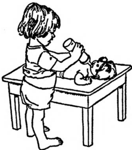
«Пойм» куклу водой

Используя куклу, «писающую» в штанишки, вы научите ребенка тем действиям, которые понадобятся ему для «походов» на горшок, а также покажете, что они получают одобрение. Пусть малыш научит куклу выполнять эти действия и похвалит ее за послушание. Помогайте ребенку с помощью указаний, направляйте его действия, чтобы он лучше вас понял. Перед началом обучения наденьте кукле одноразовые трусики и наполните ее небольшим количеством воды.