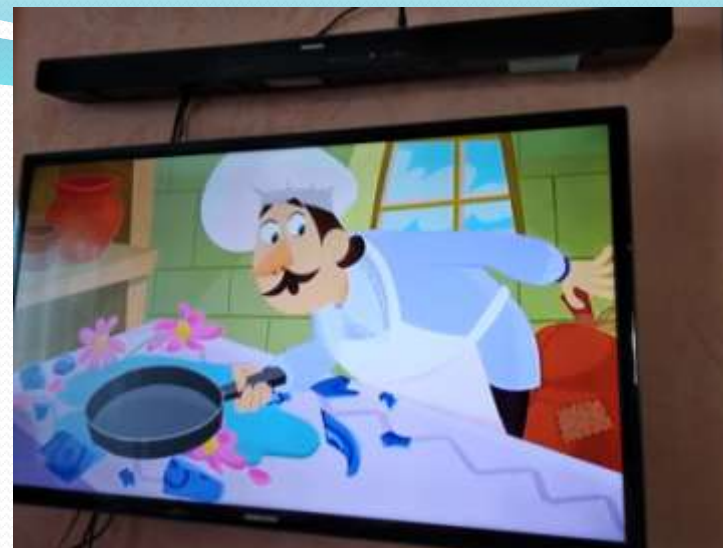
Рабочий сектор (ИКТ для педагога)