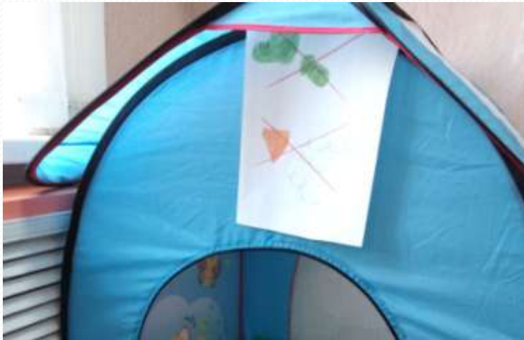
Место для отдыха и уединения