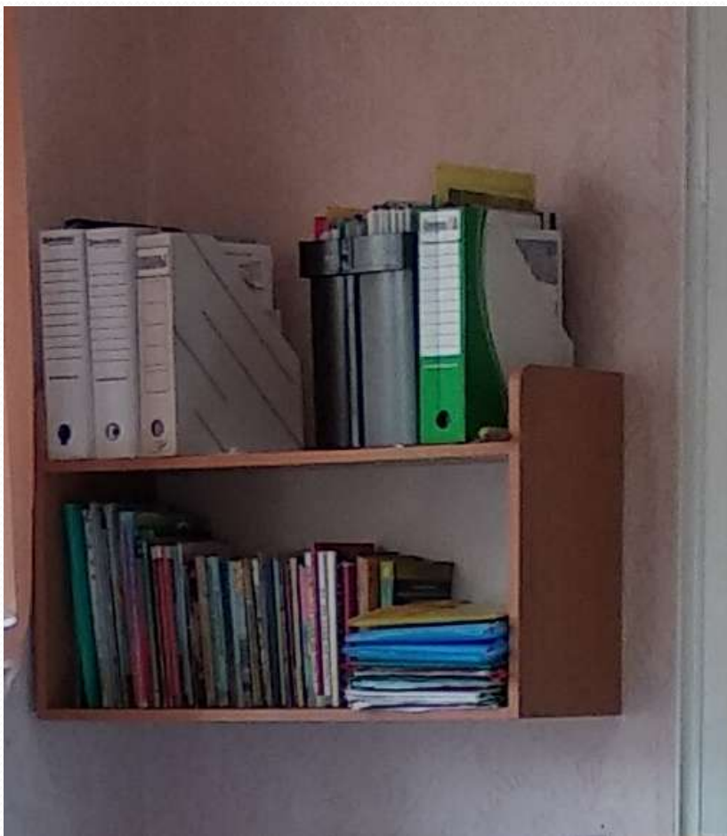
Рабочий сектор (методическая литература педагога)