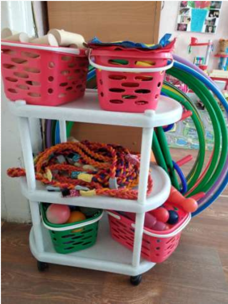
Физкультура и спорт