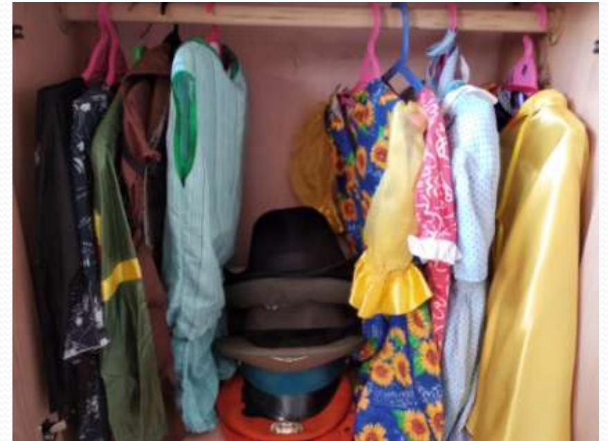
Наследие культуры и социокультурные ценности