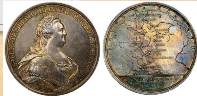
Медаль в память путешествия Императрицы Екатерины II в Крым. 1787 г.