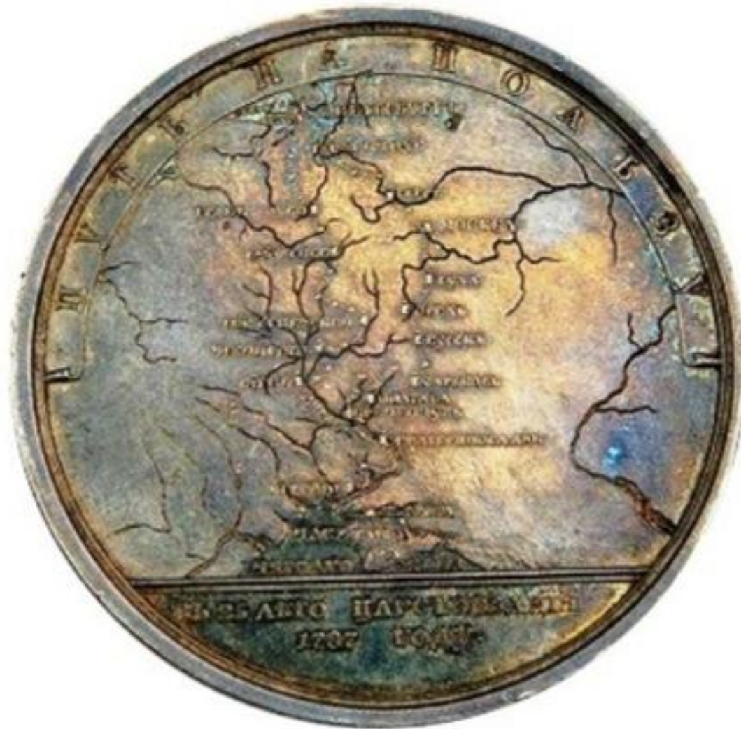
Медаль в память путешествия Императрицы Екатерины II в Крым. 1787 г.