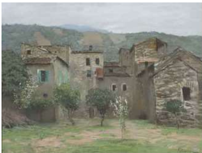
И.Левитан. Вид в окрестностях Бордигеры в Италии. 1890. Бумага, пастель. Вариант одноименной картины (1890. ГТГ)