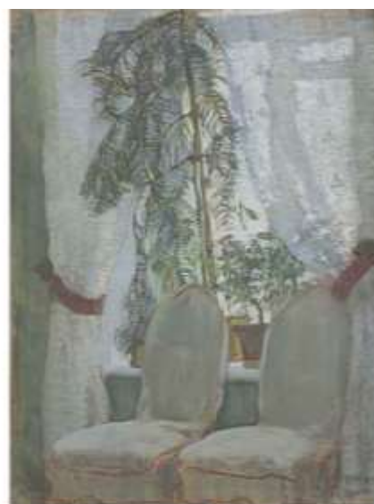
К.Юон. Окно. 1905. Картон, пастель