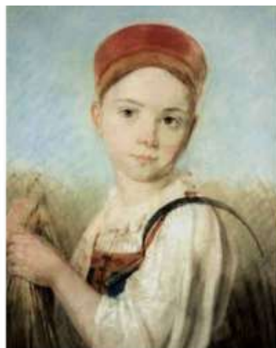
А.Венецианов. Крестьянская девушка с серпом во ржи. Пергамент, дублированный на холст, пастель. Конец 1810 начало 1820-х годов.