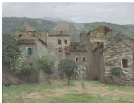
И.Левитан. Вид в окрестностях Бордигеры в Италии. 1890. Бумага, пастель. Вариант одноименной картины (1890. ГТГ)