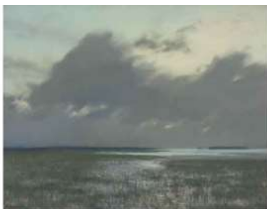
И.Левитан. Разлив. 1895. Бумага на картоне, пастель