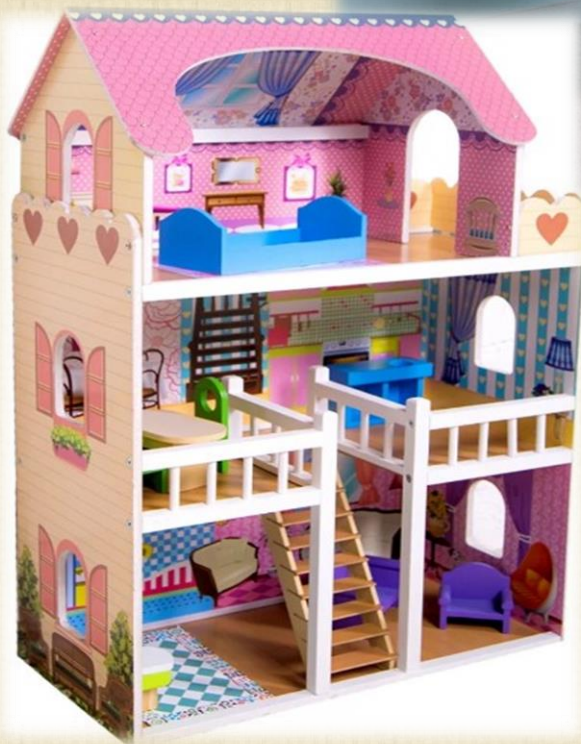
Кукольный домик с мебелью SUNNYTOY Варя Цена: 5490 руб.