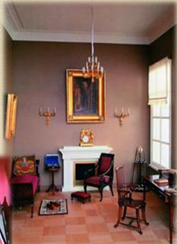
«Нащокинский домик». Кабинет. 1830-е. Всероссийский музей А.С. Пушкина. Санкт- Петербург.