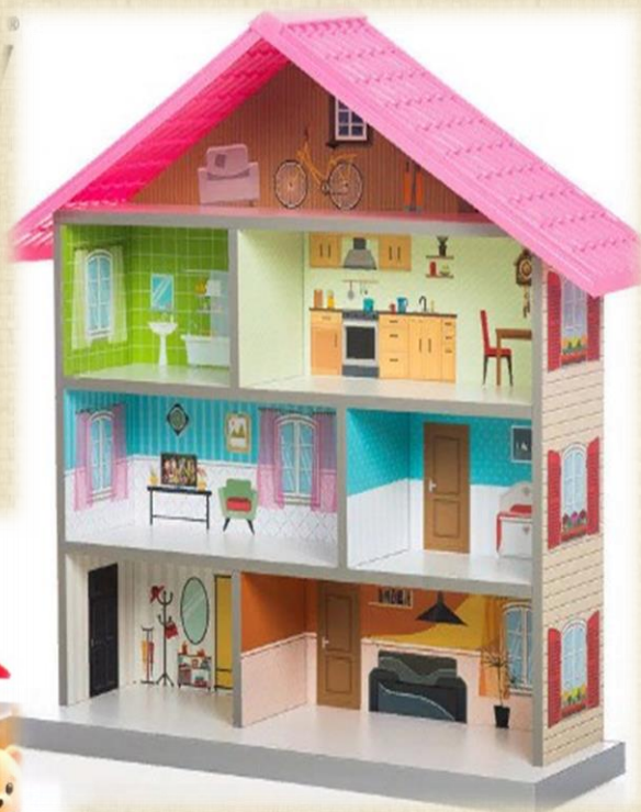
Кукольный домик Anbeya Family 1514 с люстрой (для фигурок до 14 см и куколок лол) Цена: 1802 руб.