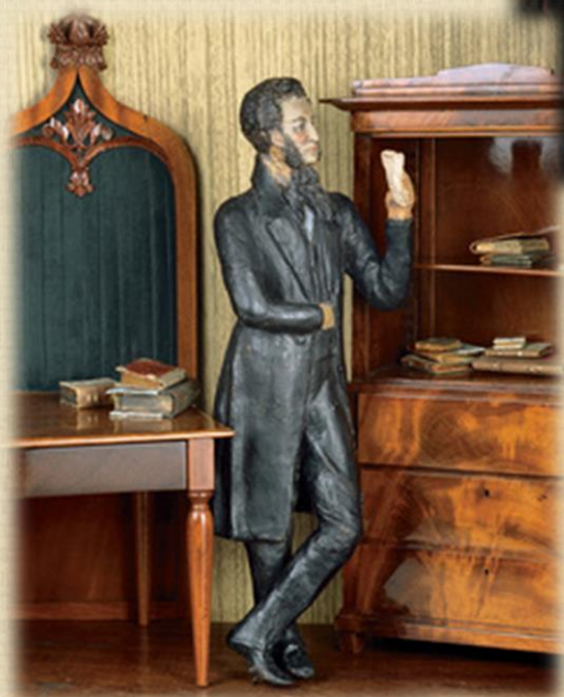
А.С. Пушкин в интерьере «Нащокинского домика». Гипс.

Автор модели Н.А. Степанов (?). Всероссийский музей А.С. Пушкина. Санкт-Петербург.