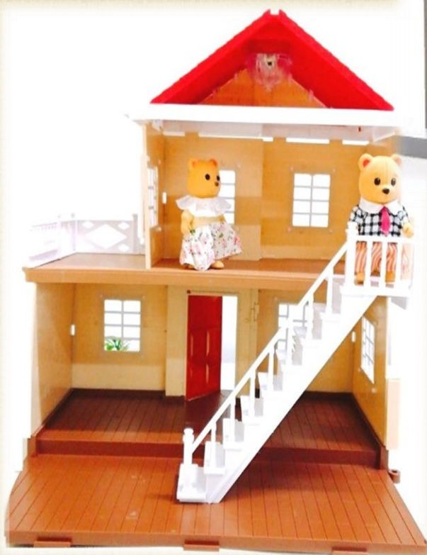
Кукольный домик MiMi Цена: 2900 руб.