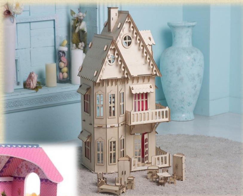
Кукольный домик «Солнечный». Цена: 1290 руб.