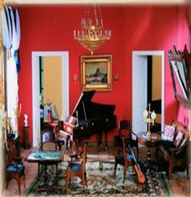
«Нащокинский домик». Гостиная. 1830-е гг. Всероссийский музей А.С. Пушкина. Санкт-Петербург.