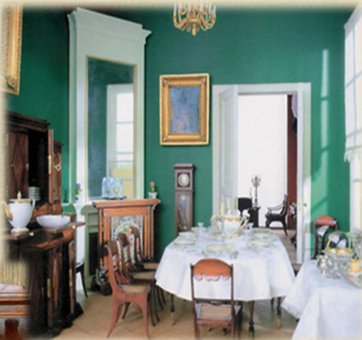
«Нащокинский домик». Столовая. 1830-е гг. Всероссийский музей А.С. Пушкина. Санкт-Петербург.