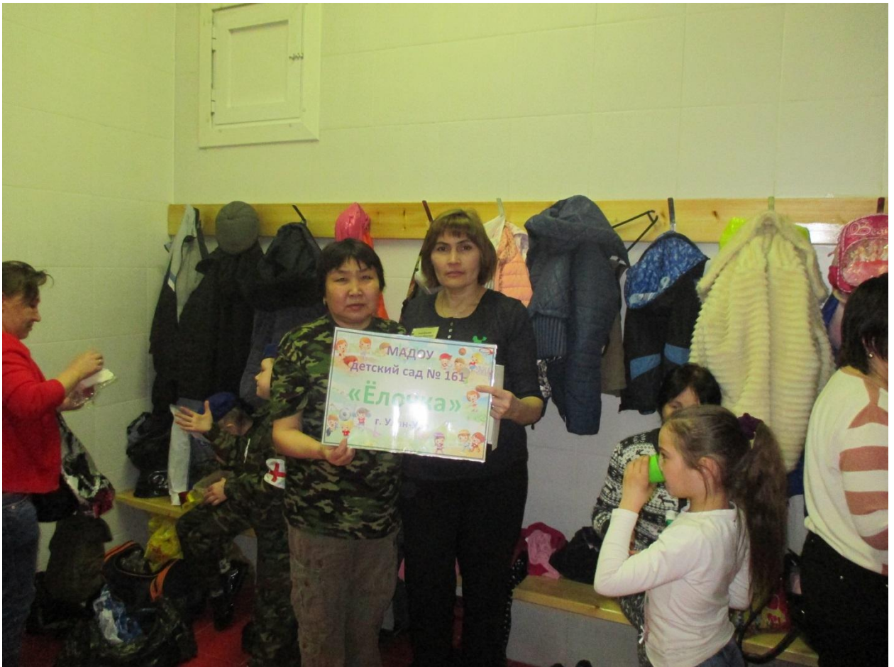
Приложение № 4 Фотоотчёт