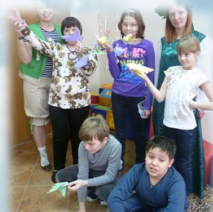
Учимся быть вместе