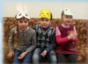
Репетируем сказку «Теремок»