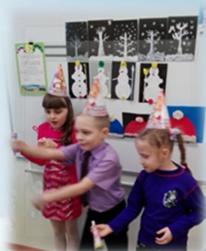
Празднование Дня рождения

Цель – развитие средств общения и взаимодействия детей с РАС. В работе используются как общеизвестные методики, так и авторские разработки.