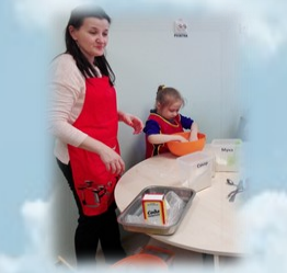
Учимся замешивать тесто для печенья

развитие их интересов и способностей. На формирование социальных навыков. Цель – помочь детям с аутизмом приобрести социальные навыки и жизненно-необходимые навыки, занимаясь разнообразной практической деятельностью.