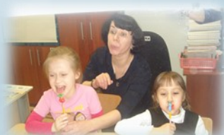
Занятие с логопедом

Специалисты ориентируются на индивидуальные особенности каждого ребенка