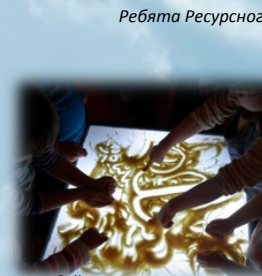
Любой рисунок становится необычным

На занятиях используются различные материалы, которые помогают детям развивать свои навыки и способности.