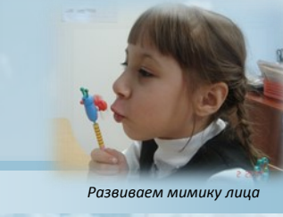
Развиваем мимику лица