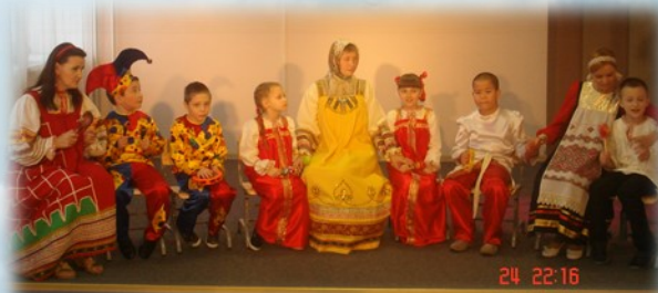
Первое выступление ансамбля «Дети дождя»

На развитие когнитивных функций. коррекция и развитие познавательных возможностей детей с аутизмом, их эмоционально-волевой сферы, формирование положительной мотивации к