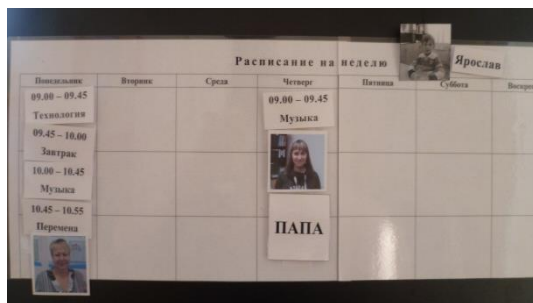
Визуальное расписание на неделю для ребенка с РАС в КУ «Нижевартовская общеобразовательная санаторная школа»