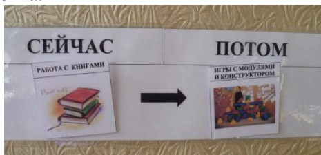
Планшет «СНАЧАЛА - ПОТОМ»

Планшет «СНАЧАЛА - ПОТОМ» может помочь в обучении детей с расстройствами аутистического спектра следовать инструкциям и приобретать новые навыки. Такой планшет мотивирует их к совершению деятельности, которая им не нравится, а также уточняет, когда они смогут делать то, что им нравится. Планшеты такого формата определяют основу речи, необходимую для выполнения ребенком многоступенчатых указаний и цепочек действий, а также для использования более сложных визуальных систем. Располагается планшет «СНАЧАЛА - ПОТОМ» перед глазами ребенка.