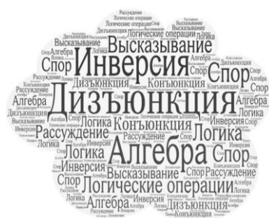
Рисунок 1 Облако слов к теме

Стоит отметить, что облако слов, предложенное в начале урока, не только позволит