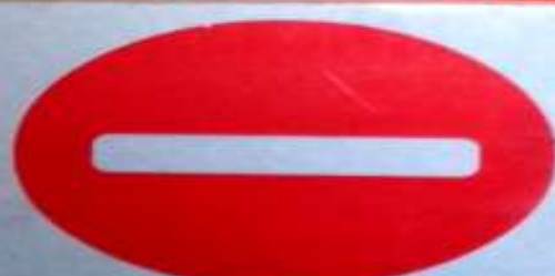
3.1 ВЪЕЗД ЗАПРЕЩЕН