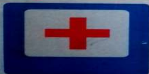
6.1 ПУНКТ ПЕРВОЙ МЕДИЦИНСКОЙ ПОМОЩИ

ВНИМАНИЕ! Светофоры, регулировщики и дорожные знаки.