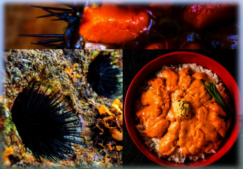
Уни – Морской ёж