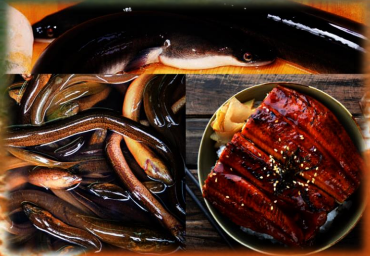
Унаги или Японский пресноводный угорь