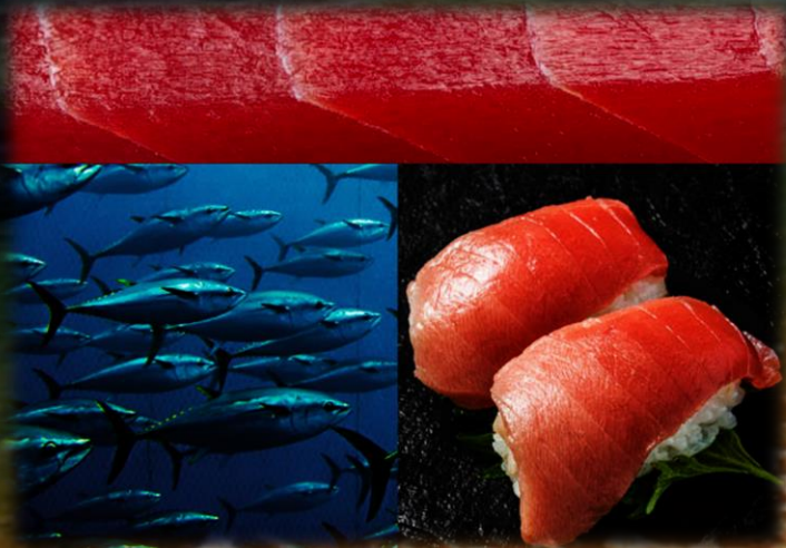
Магуро – Синехвостый тунец