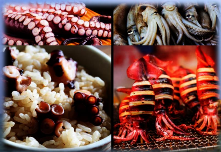
Тако и ика – осьминог и кальмар