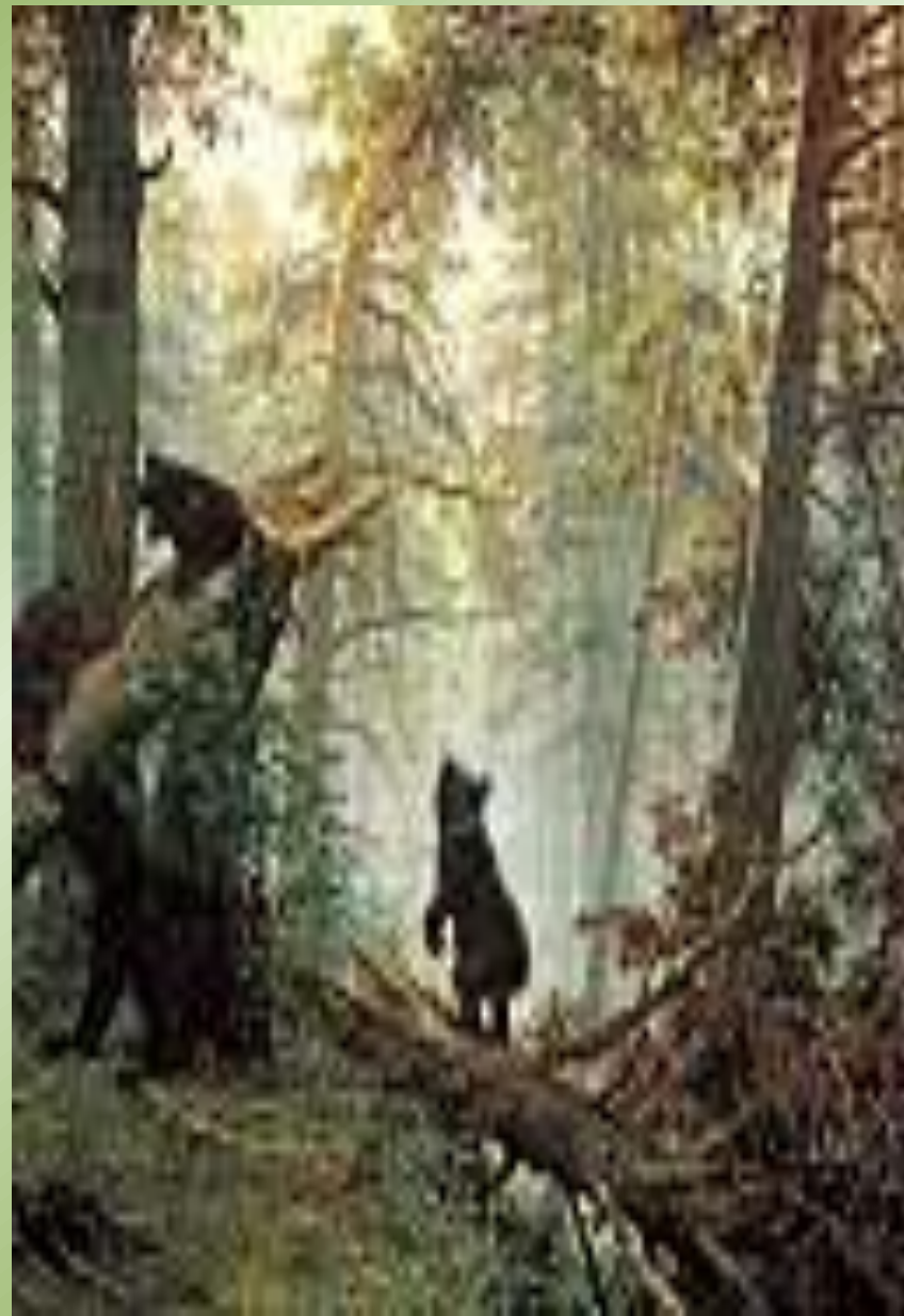
И.Шишкин « Утро в сосновом бору»