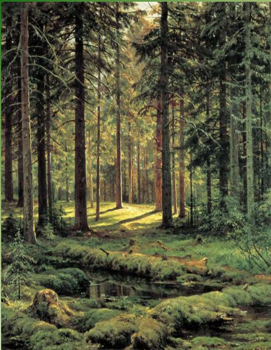
И.Шишкин « В сосновом бору»