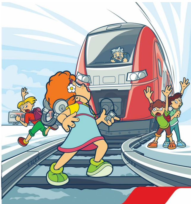
Плеер и железная дорога - несовместимы!