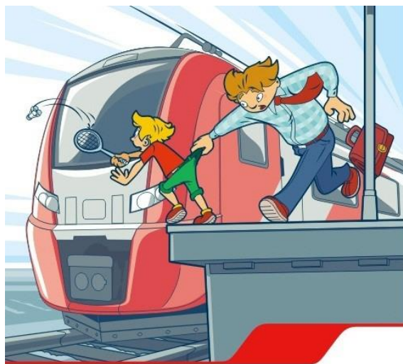
Платформа – не место для игр!