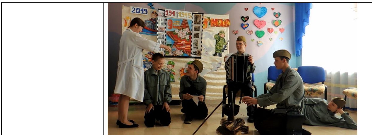
5. Стихотворение «Дети войны» автор Светлана Сирена