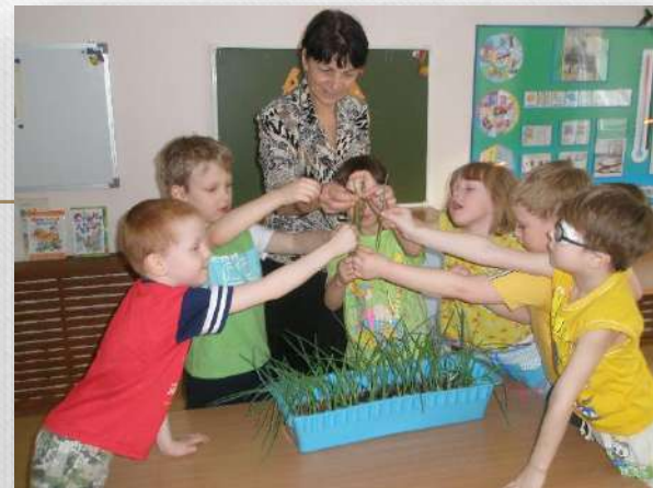
Проект «Лук зеленый»