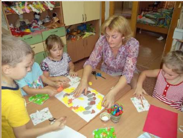
Проект «Осенний сюрприз»