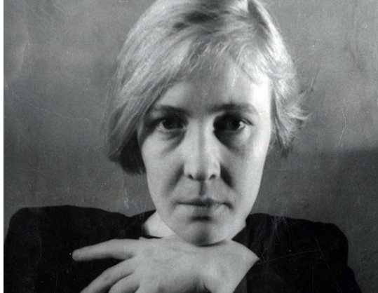
3. Ольга Берггольц