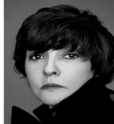
4. Белла Ахмадулина