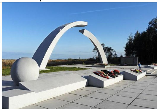
3. Мемориал «Разорванное кольцо»