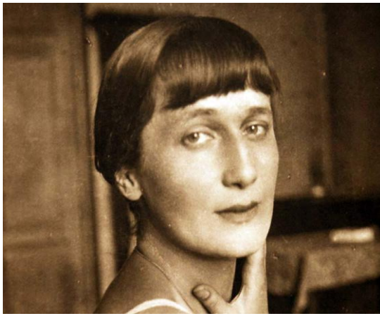
1. Анна Ахматова