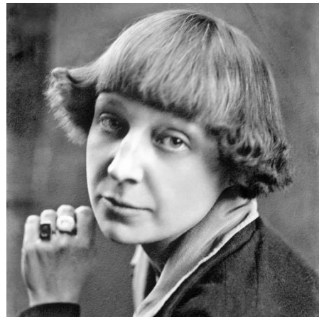
2. Марина Цветаева