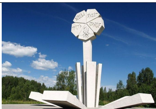
1. «Цветок жизни»