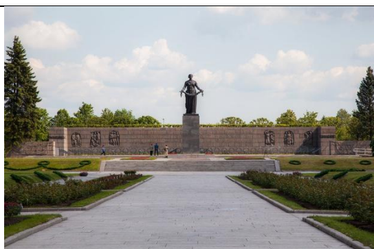
2. Пискаревское кладбище