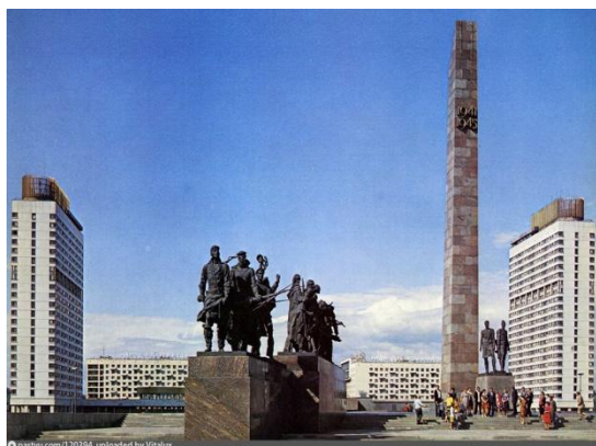
4. площадь Победы