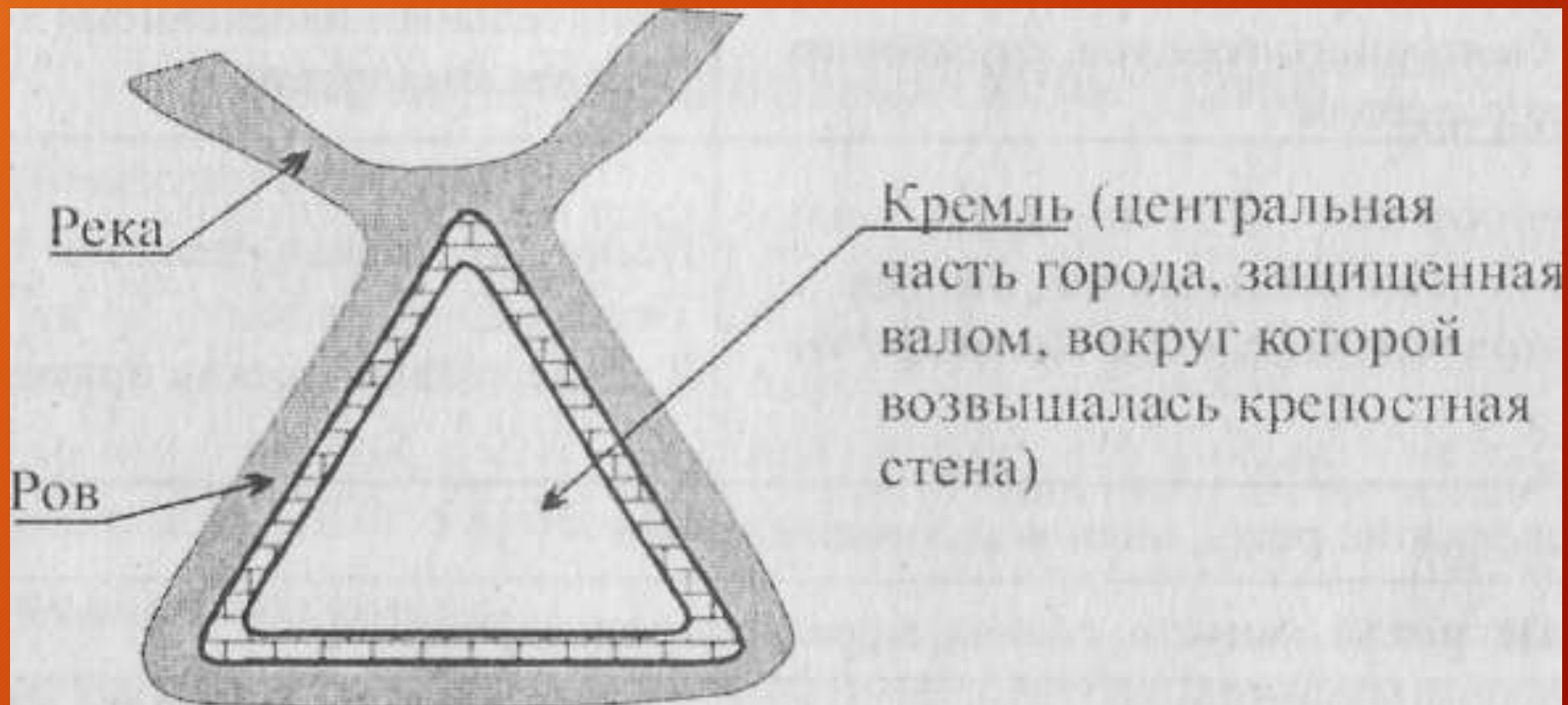
Схема древнего города:

Города как центры ремесла и торговли обычно располагаются на холме у излучины рек.