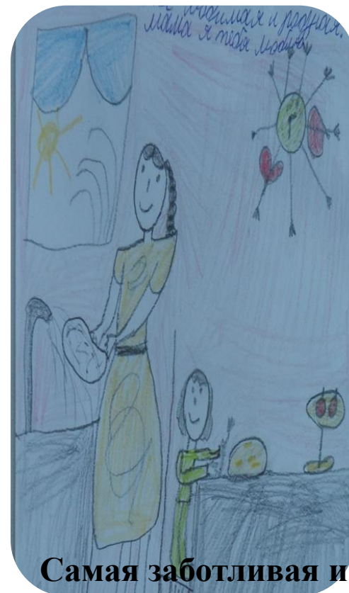
Самая заботливая и лучшая на свете