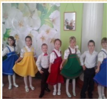
Наш вокальный ансамбль

В ноябре 2017 года МДОАУ «Детский сад №95 г. Орска» в рамках индивидуального образовательного маршрута в области музыкально-эстетической направленности для одарённых детей совместно с семьями воспитанников был подготовлен конкурсный номер, который получил высокую оценку жюри и отмечен Дипломом лауреата 2 степени.