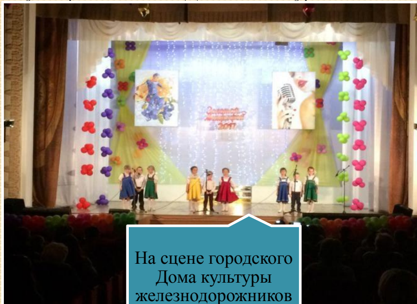
На сцене городского Дома культуры железнодорожников