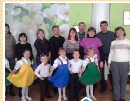
В конкурсе принимали участие вместе с родителями