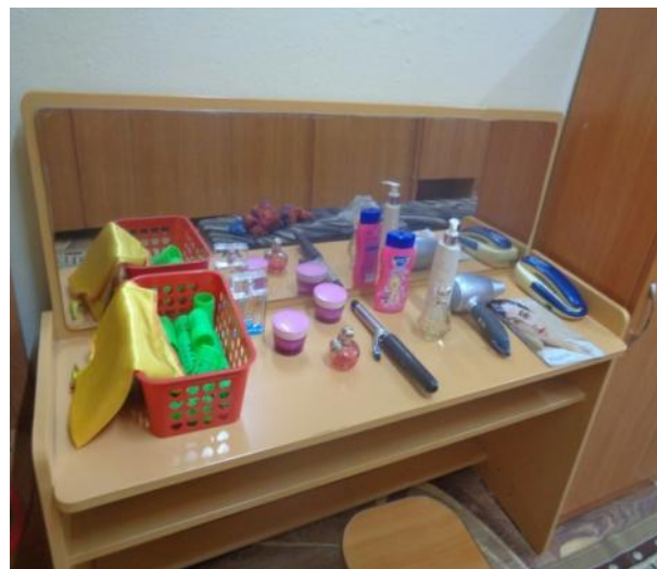
Сюжетно-ролевая игра «Парикмахерская»

Сюжетно-ролевые игры – развивают игровой опыт каждого ребенка; воспитывают коммуникативные навыки, желание объединиться для совместной игры. Дети учатся соблюдать в игре определенные правила, у них развиваются творческое воображение и фантазия