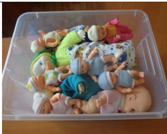
Сюжетно-ролевая игра «Семья»