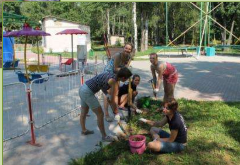
Россия Смоленск 2013 год