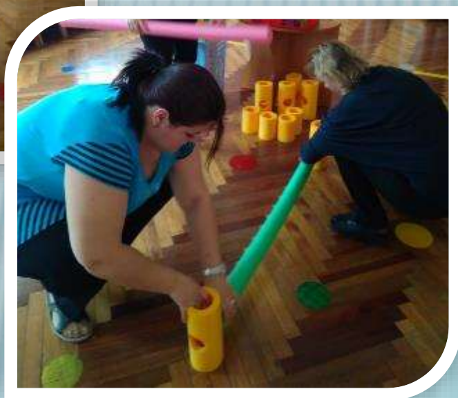
Мастер-класс для педагогов «Нудл-Микс»