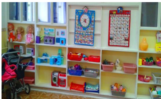
ЦЕНТР ИГРЫ ПРИРОДЫ