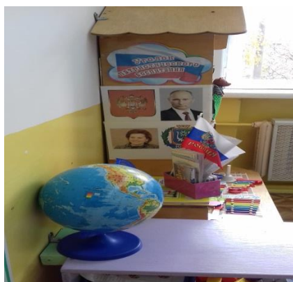
ЦЕНТР ПАТРИОТИЧЕСКОГО ВОСПИТАНИЯ