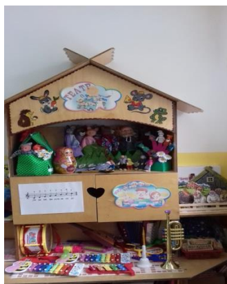
ЦЕНТР МУЗЫКИ, ТЕАТРА