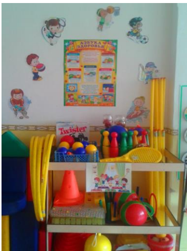
ЦЕНТР ДВИГАТЕЛЬНОЙ АКТИВНОСТИ