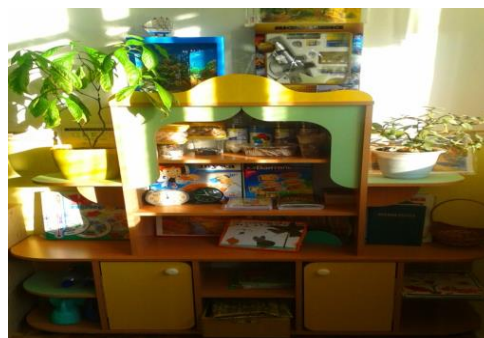
ЦЕНТР ЭКСПЕРИМЕНТИРОВАНИЯ И ПРИРОДЫ