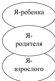
Рис. 4. Три Эго-состояния

В психологии одним из подходов к изучению личности является подход трансактного анализа. Автор подхода (Э. Берн) утверждал, что в каждом из нас существует 3 Эго-состояния (рис. 4).