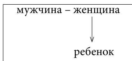
Рис. 1. Пространство психологической близости