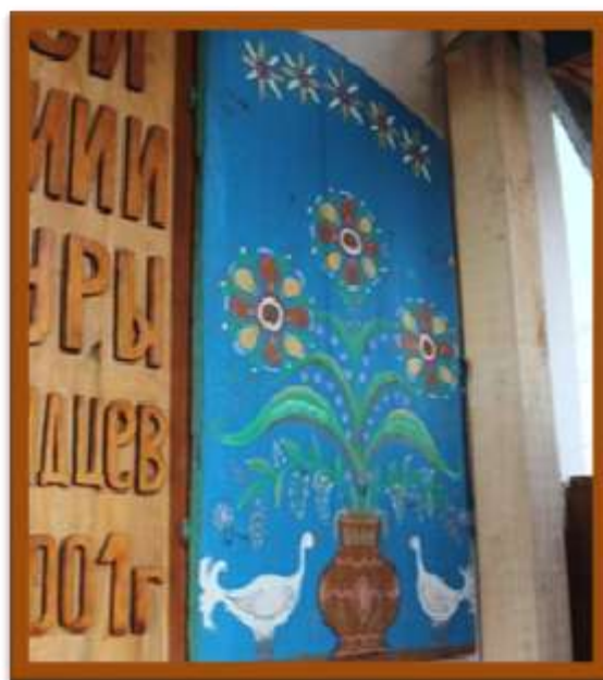
Музей с. Тарбагатай