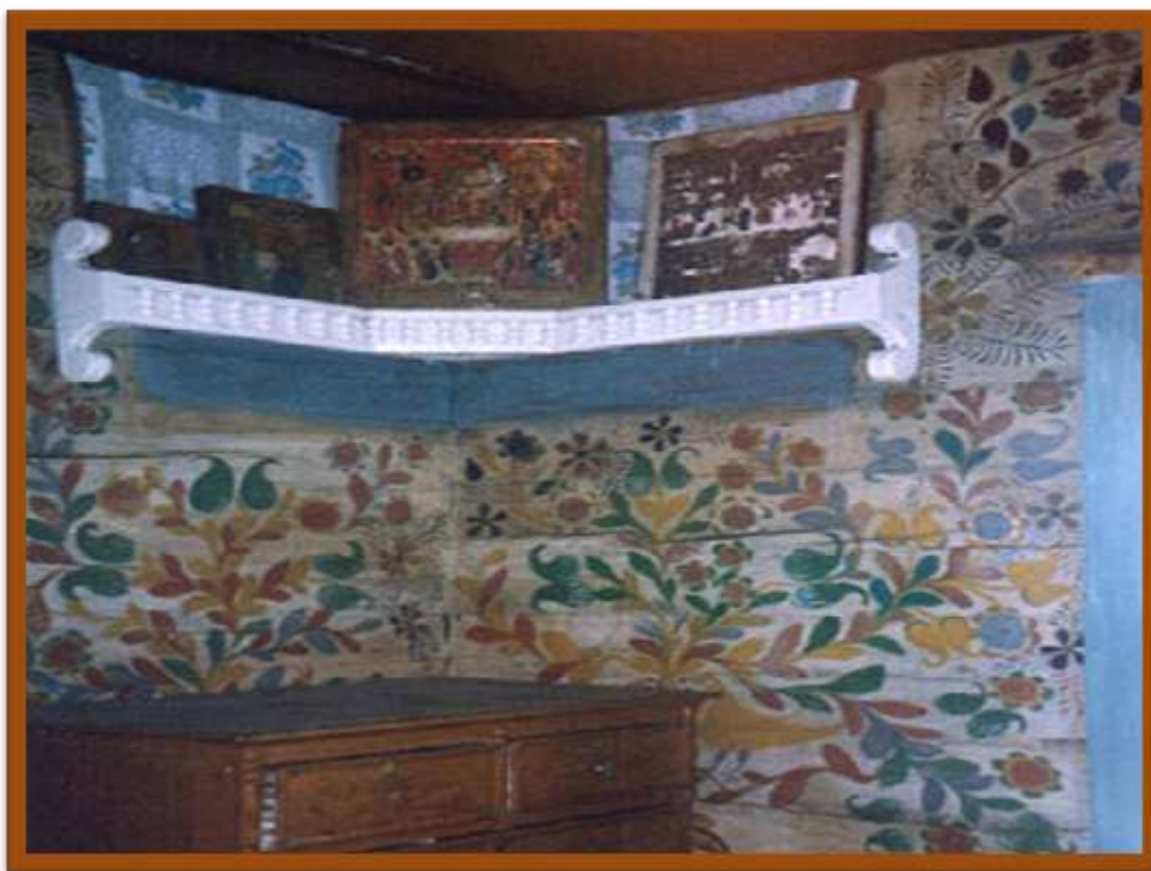
Ансамбль Домовой росписи в доме Пискуновых. Село Десятниково Тарбагатайского района Республики Бурятия