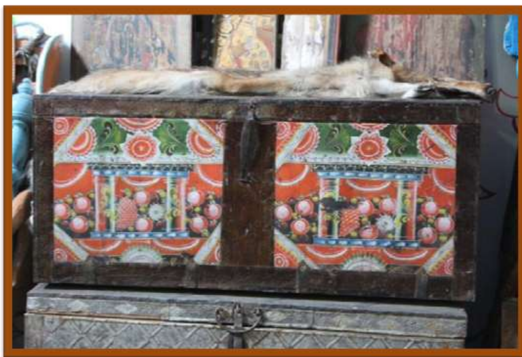
Сундук с яркими цветами