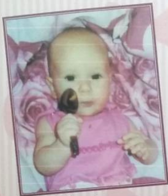
Мне 6 месяцев.