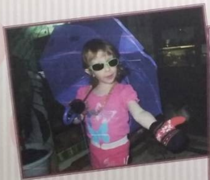
Мне 6. Выступаю.