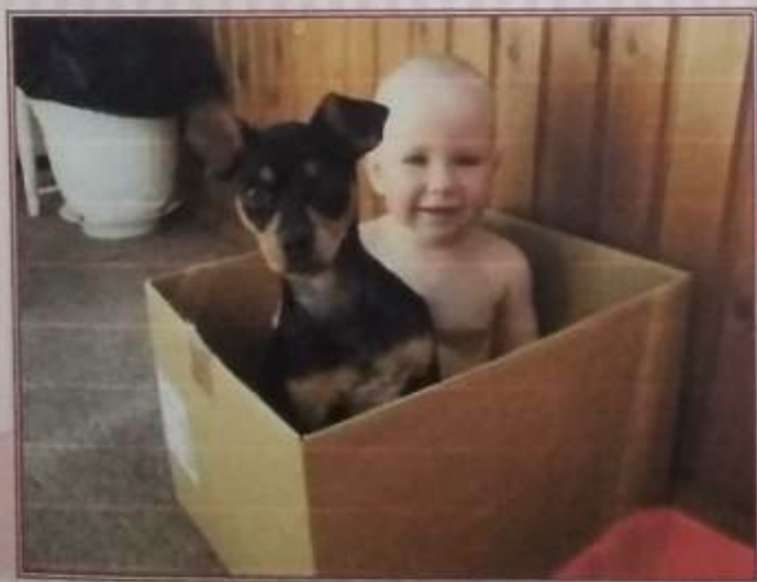
Мне 2 года. Друзья.