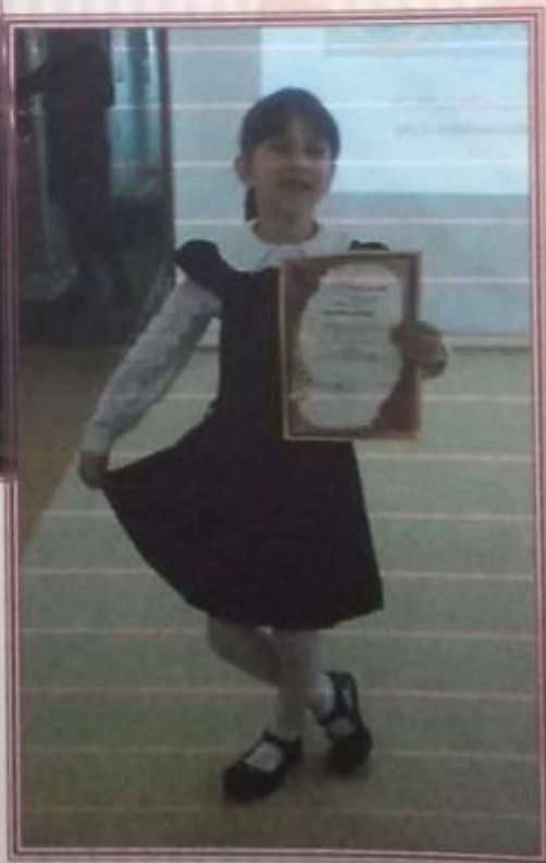
Почти семь. Скоро в школу!