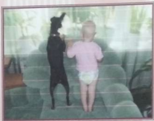
В 1 год с Тяпой.