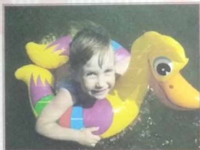
Мне 4. Учусь плавать.