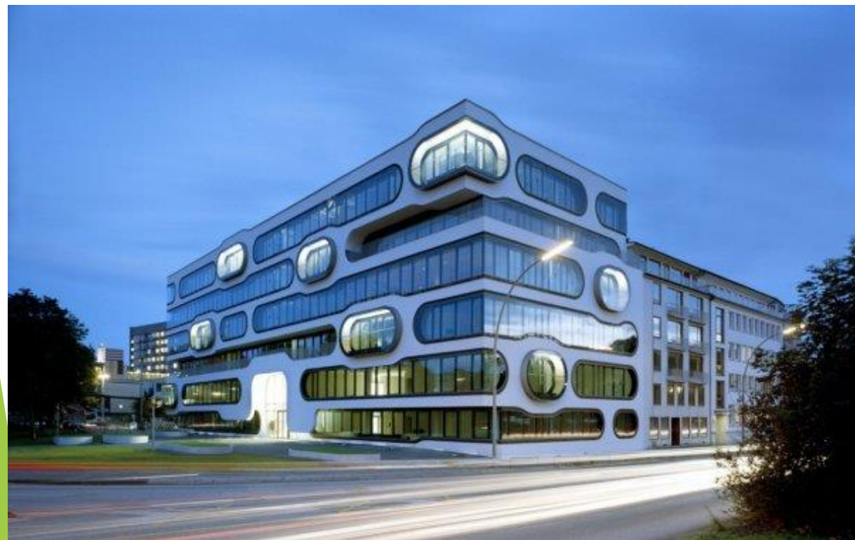
Административное здание в Гамбурге