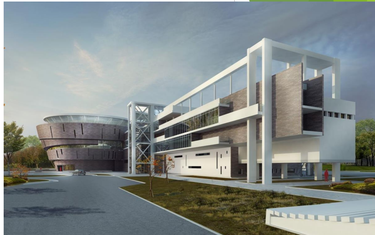
Досуговый центр в Екатеринбурге