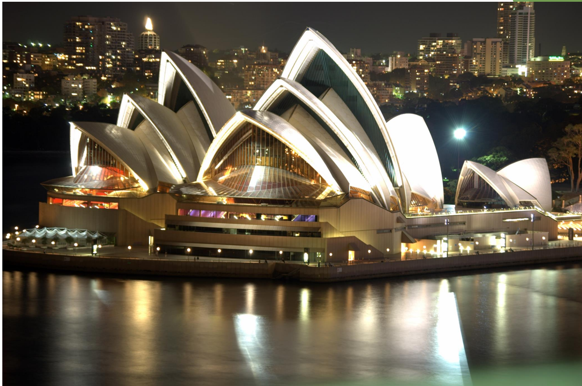
Сиднейский оперный театр