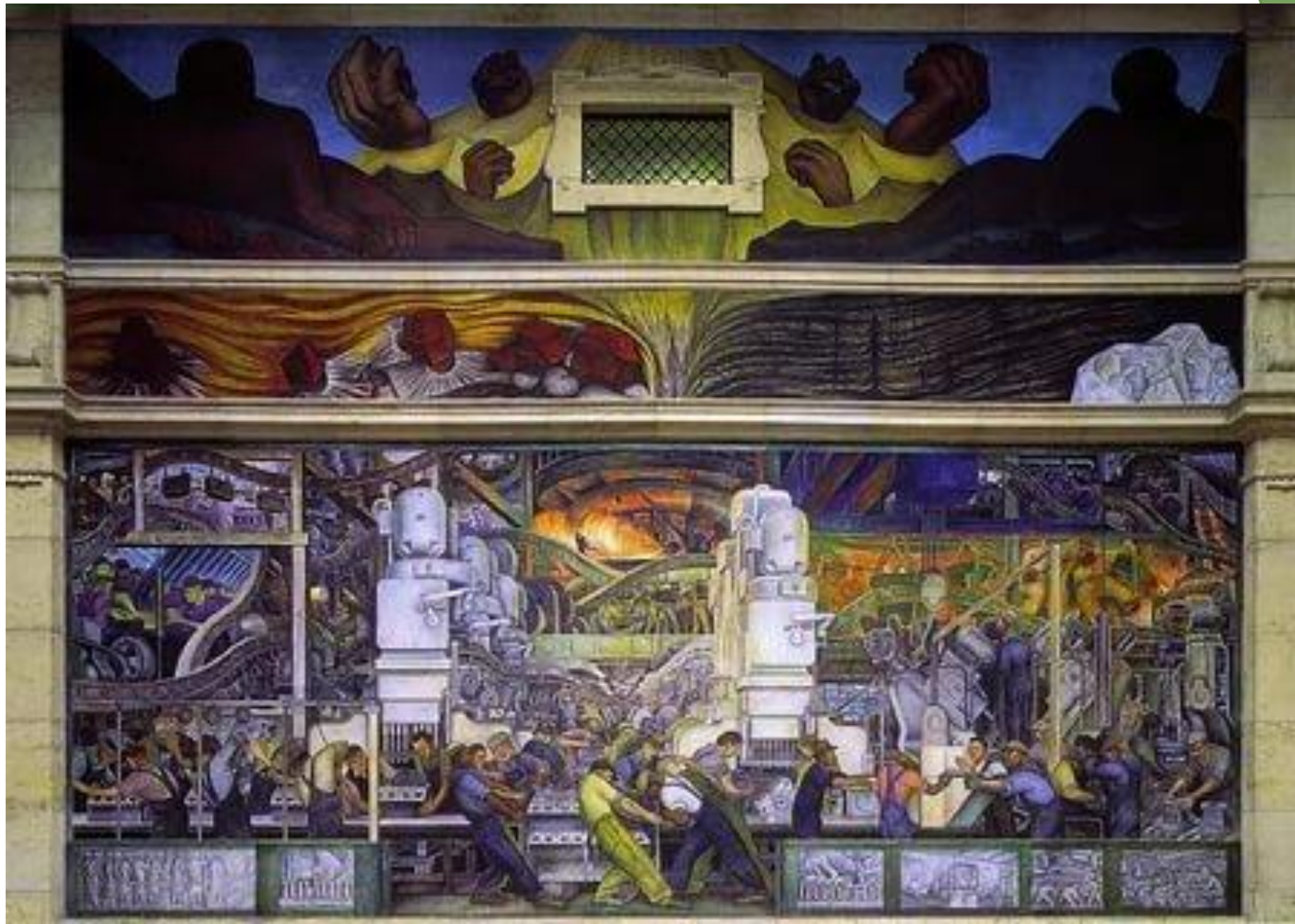
Д. Сикейрос. Индустрия Детройта. Роспись стены. Детройт