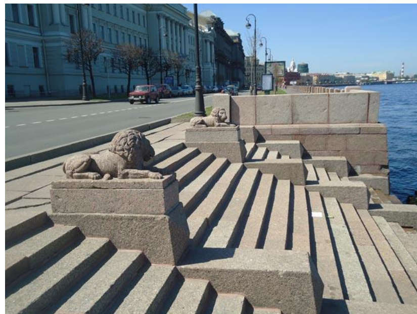
Львы у Пушкинского дома