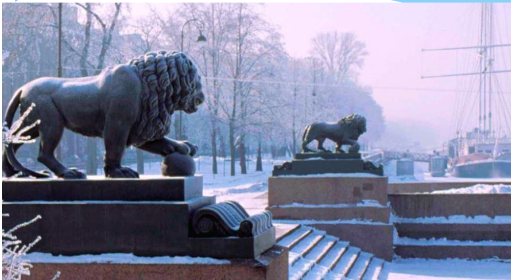
Львы на Дворцовой пристани