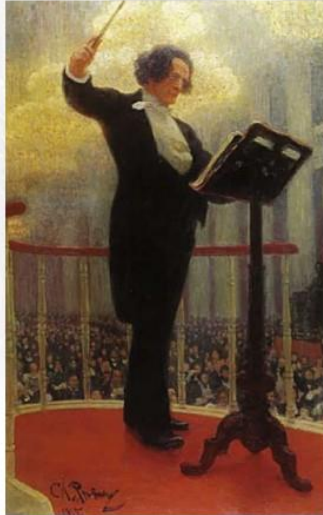
И. Репин. Антон Рубинштейн

Рассмотрите изображения людей. Определите, в какое время они созданы, какие особенности личности (облик, черты характера, увлечения, социальная принадлежность и др.) стремились подчеркнуть в них художники. Какие средства выразительности помогли вам понять это?