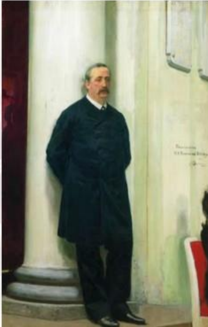
И. Репин. А. Бородин

Рассмотрите изображения людей. Определите, в какое время они созданы, какие особенности личности (облик, черты характера, увлечения, социальная принадлежность и др.) стремились подчеркнуть в них художники. Какие средства выразительности помогли вам понять это?