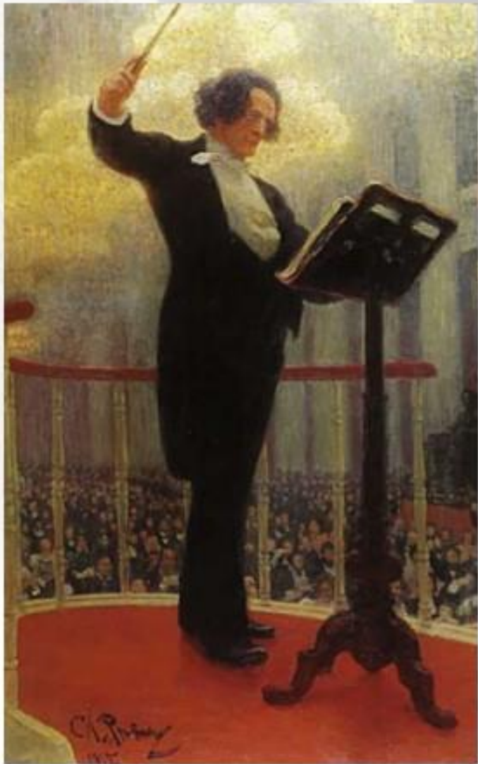
И. Репин. Антон Рубинштейн