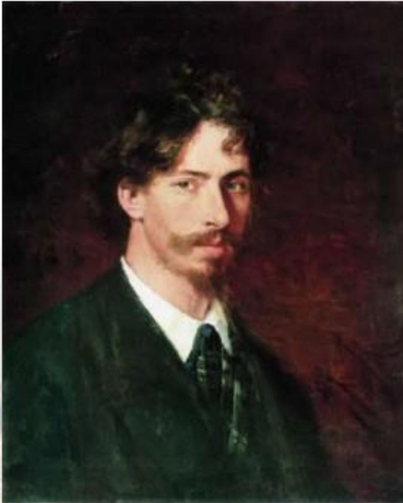
И. Репин. Автопортрет.

Портретный жанр занимает значительное место в творчестве русского художника Ильи Ефимовича Репина (1844—1930). Обращение к портретной галерее этого художника дает возможность современным зрителям узнать о его многочисленных творческих связях с деятелями отечественной науки, культуры, искусства — учеными, писателями, живописцами, музыкантами, меценатами, которые внесли свой вклад в культурное наследие России.