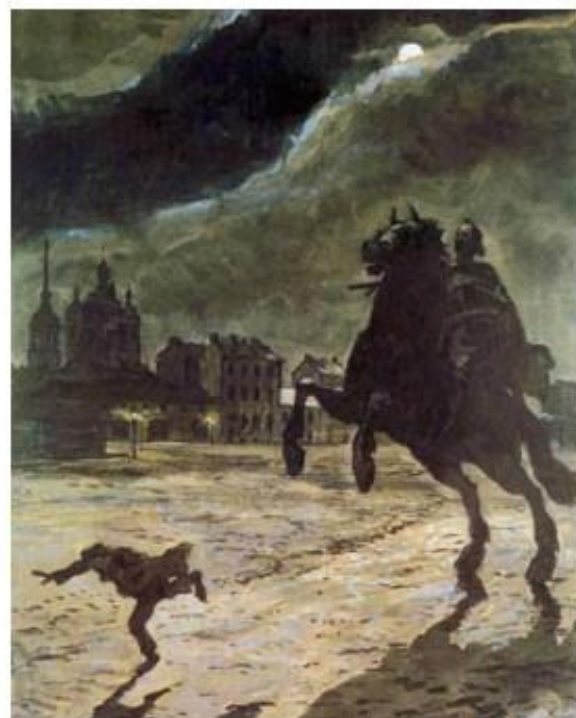
А. Бенуа. Медный всадник

В иллюстрациях А. Бенуа к произведениям А. Пушкина объединились большая эрудиция и безупречный вкус. Рисунки Бенуа к «Пиковой даме», «Медному всаднику», «Капитанской дочке» — явление высокой художественной культуры.