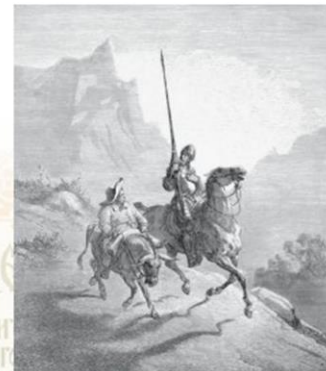
Г. Доре. Дон Кихот