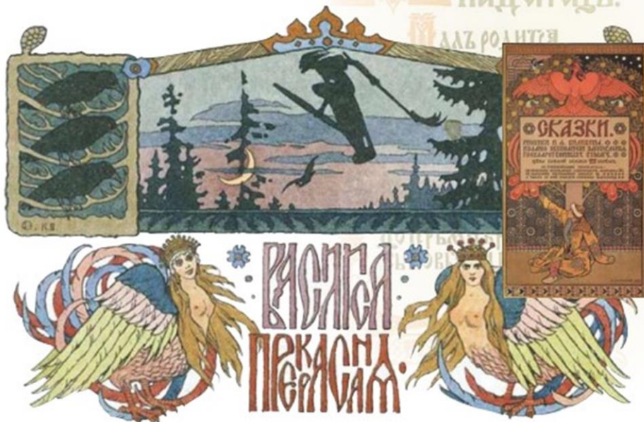
И. Билибин. Василис а прекрасная