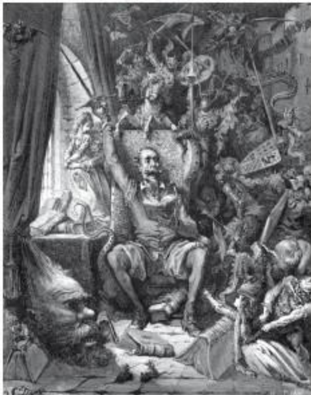
Г. Доре. Дон Кихот

Для многих поколений читателей «Робинзон Крузо» Д. Дефо неотделим от иллюстраций французского графика Гранвиля, а «Дон Кихот» М. Сервантеса, «Приключения барона Мюнхаузена» Р. Распе — от иллюстраций французского графика Г. Доре.