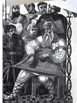
В. Фаворский. Повесть о полку Игореве...