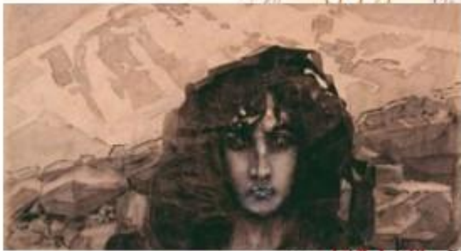
М. Врубель. Демон