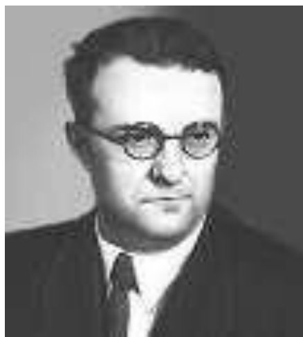
Георгий Васильевич Свиридов

В XX в. жанр иллюстрации представлен не только в книжной графике. Уникальным явлением в истории русской музыкальной культуры стало создание иллюстраций к литературным произведениям в музыке. Это и «Музыкальные иллюстрации к повести А. Пушкина «Метель» Г. Свиридова, и Симфонические гравюры «Дон Кихот» К. Караева к одноименному роману М. Сервантеса.