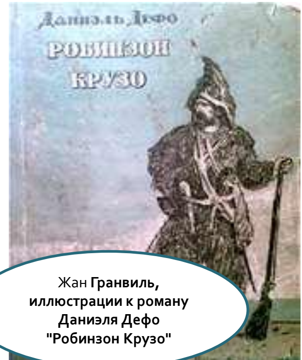
Жан Гранвиль, иллюстрации к роману Даниэля Дефо "Робинзон Крузо"