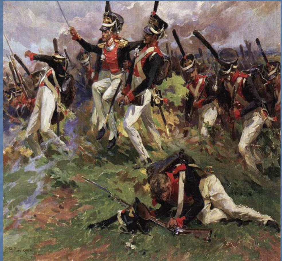
Лейб-гвардии Литовский полк в Бородинском сражении. Худ. Самокиш Н.С. 1911г