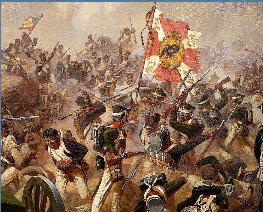
Бой за Багратионовы флеши. Худ. А. Аверьянов.