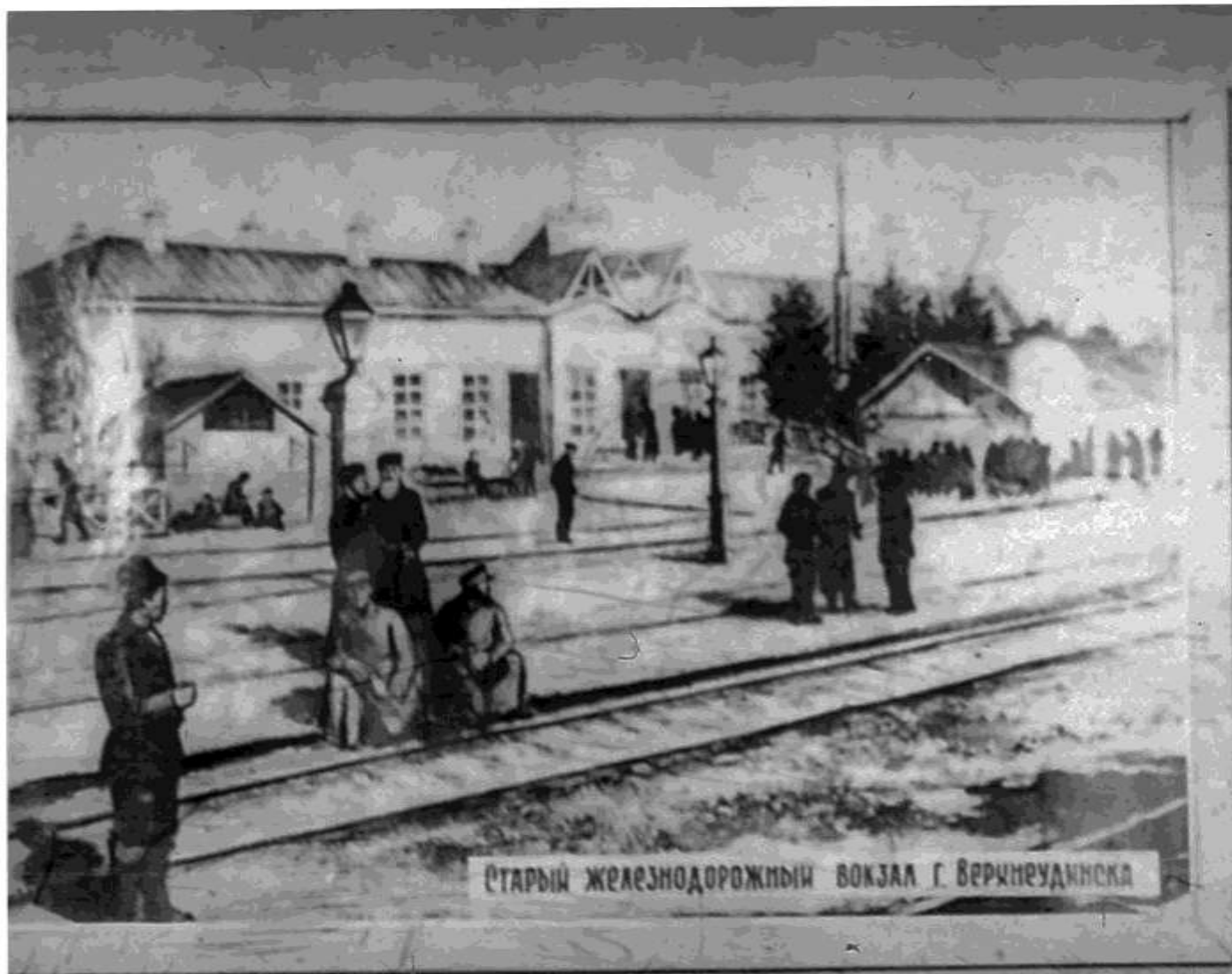
Старый железнодорожный вокзал г. Верхнеудинска

Строительство начато в 1891 г. а до конца в 1901 г. строились паровозы на станциях В то время не было ни одного паровоза Посмотря на это строили много паровозов