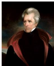
Эндрю Джексон — 7-й Президент США,

«Друзья мои! Вы сами видите, что принесла вам т. н. цивилизация! Отправляйтесь на Индейскую территорию за Миссури — и там живите той жизнью, какая вам угодна!» Джексон после серии вооружённых восстаний и депортации индейцев.