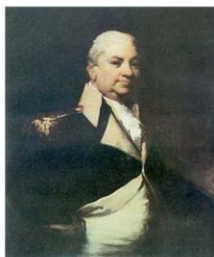
Генри Нокс 1-й военный министр США