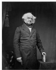
Мартин Ван Бюрен — 8-й президент США