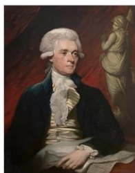
Томас Джефферсон - автор Декларации независимости, 3-й президент США, один из отцов основателей государства США.

рост населения и потребность активного развития сельского хозяйства требовали земли