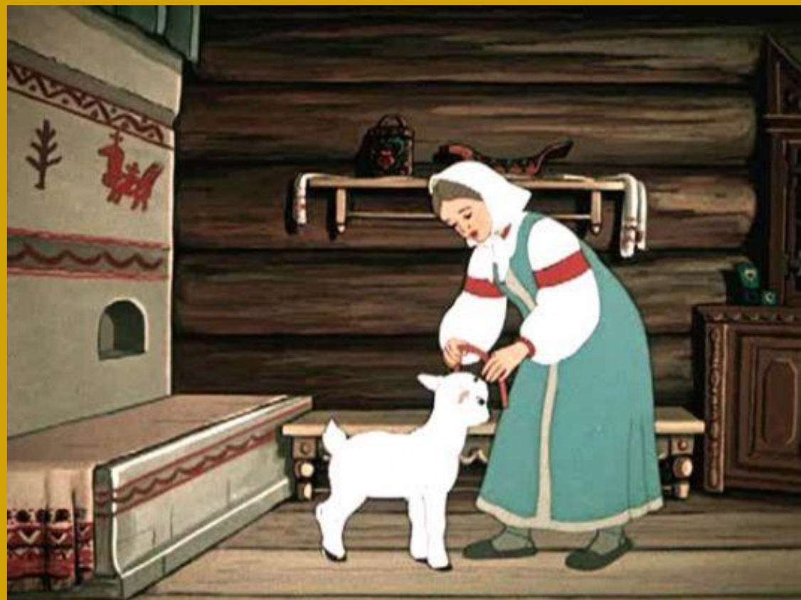
Сестрица Алёнушка и братец Иванушка

Герой этой сказки содержится в неволе. Он потерял сестру, на его жизнь покушалась ведьма, нарушая его право на личную неприкосновенность и жизнь.