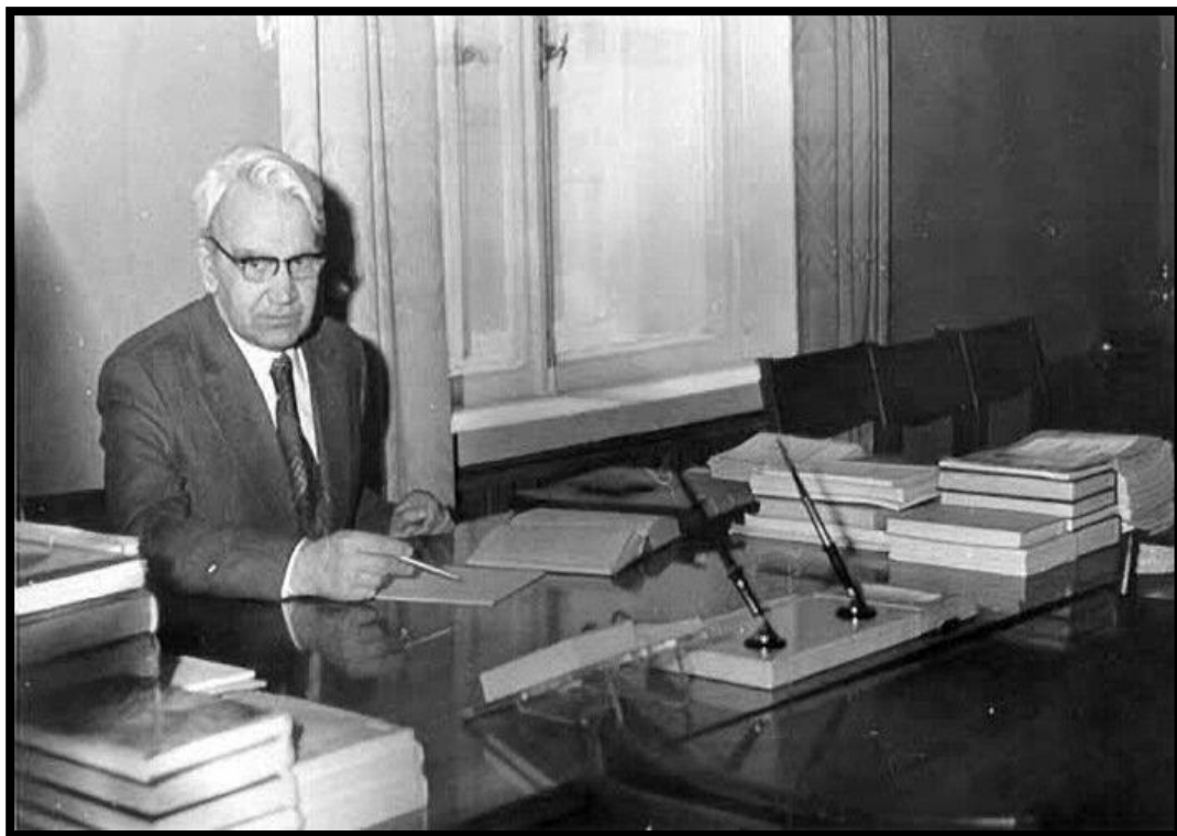
М. В. Келдыш