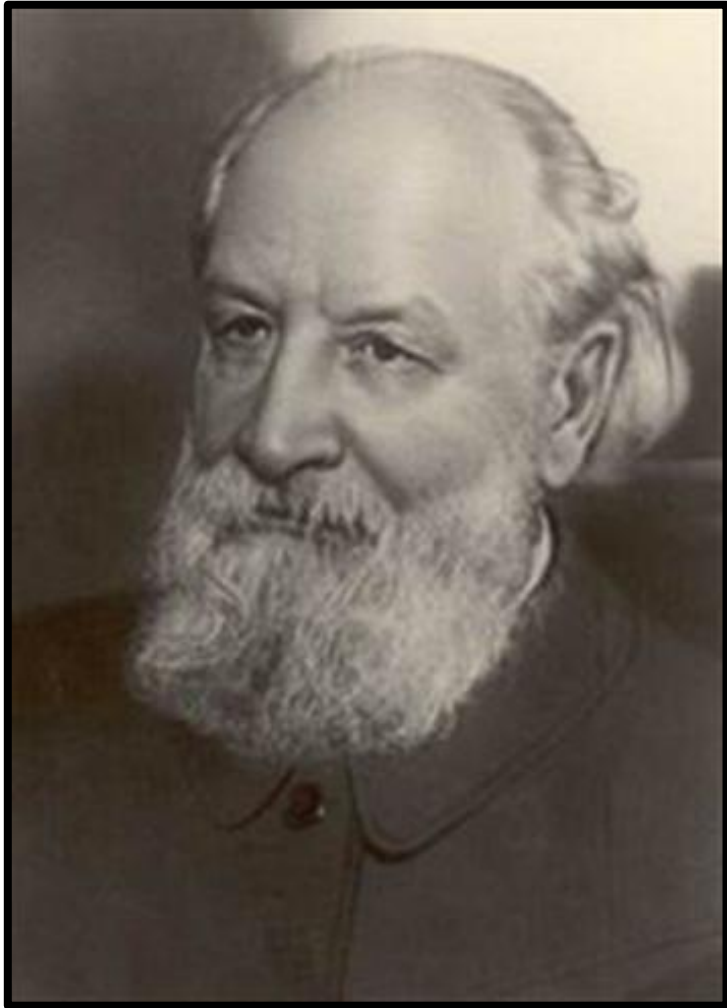
А. Н. Крылов