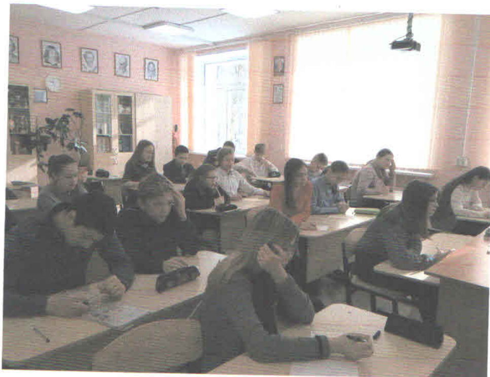
Анализ результатов анкетирования среди 5-11 классов на знание усадеб Калитинской волости