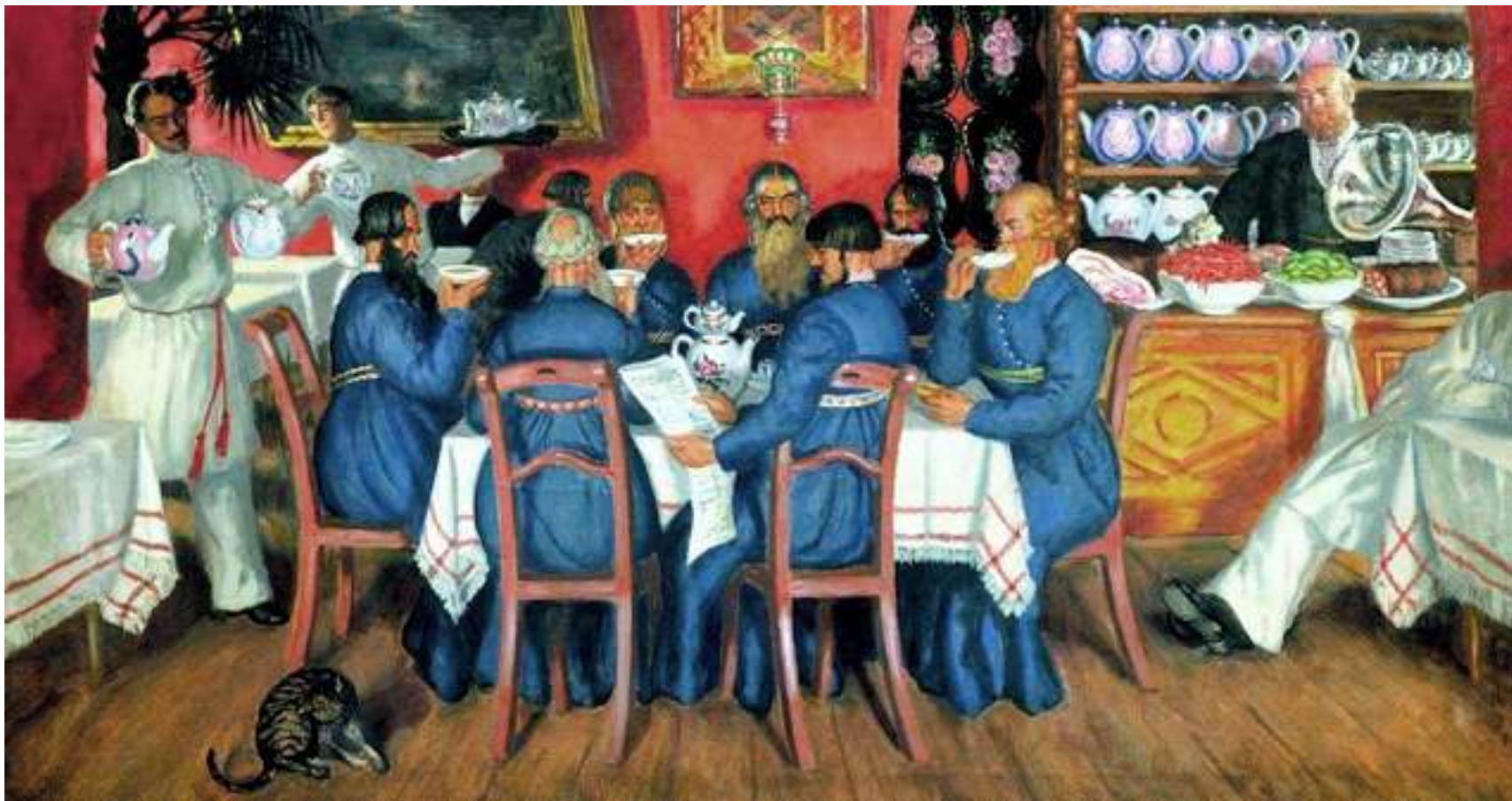
Фрагмент репродукции картины Бориса Кустодиева «Московский трактир»