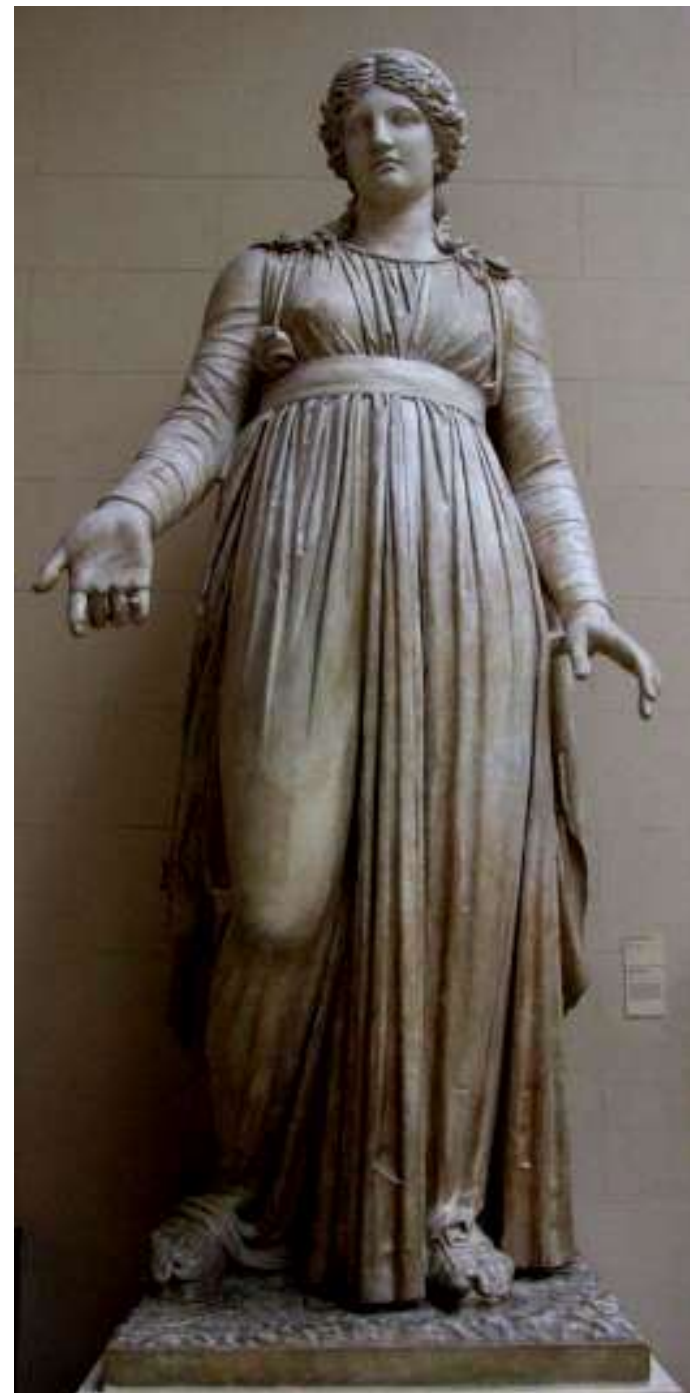
Статуя Мельпомены Мрамор