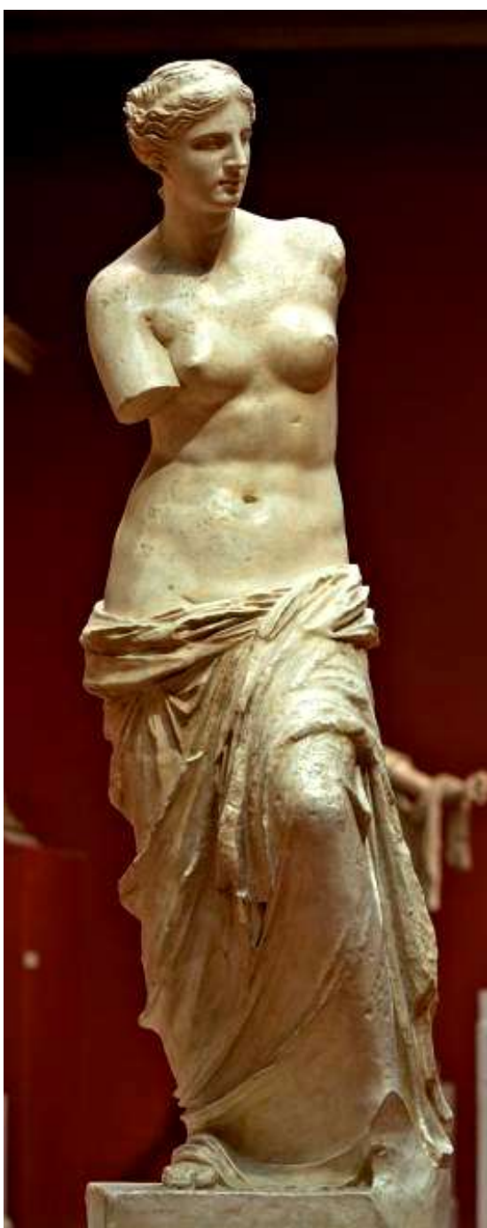
Афродита Милосская. Копия с оригинала, возможно, второй половины II в. до н.э.; найдена на о. Мелос в 1820 г. Мрамор