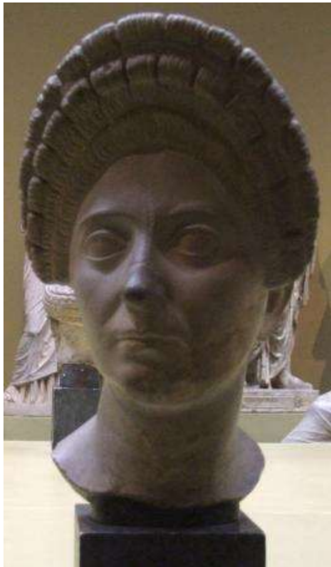
Портрет римлянки Начало II в. Мрамор