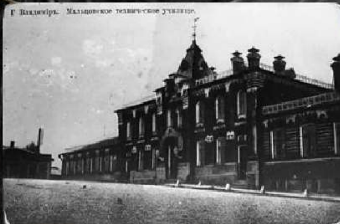
г. Владимиръ. Мальцовское техническое училище.