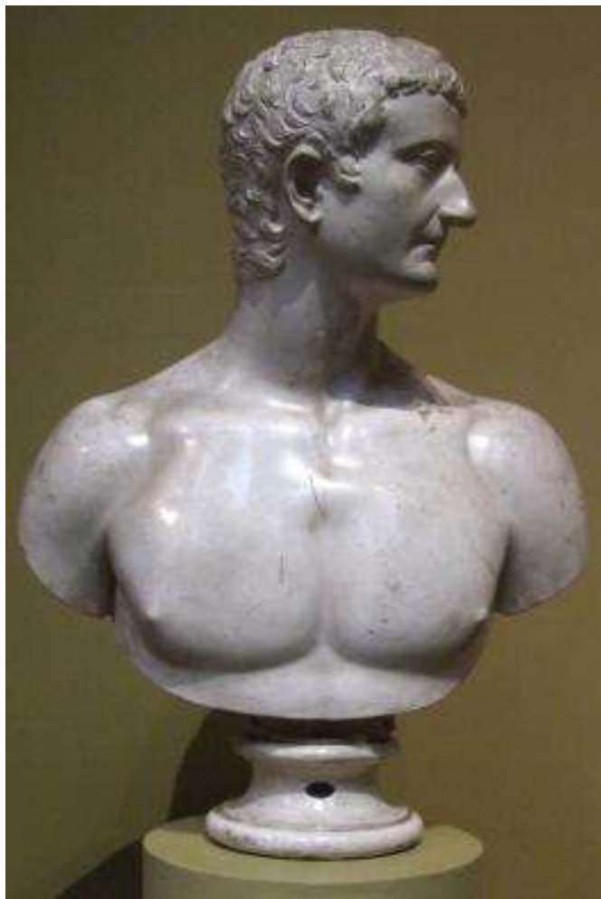
Портрет Тиберия. Первая четверть I в. Мрамор