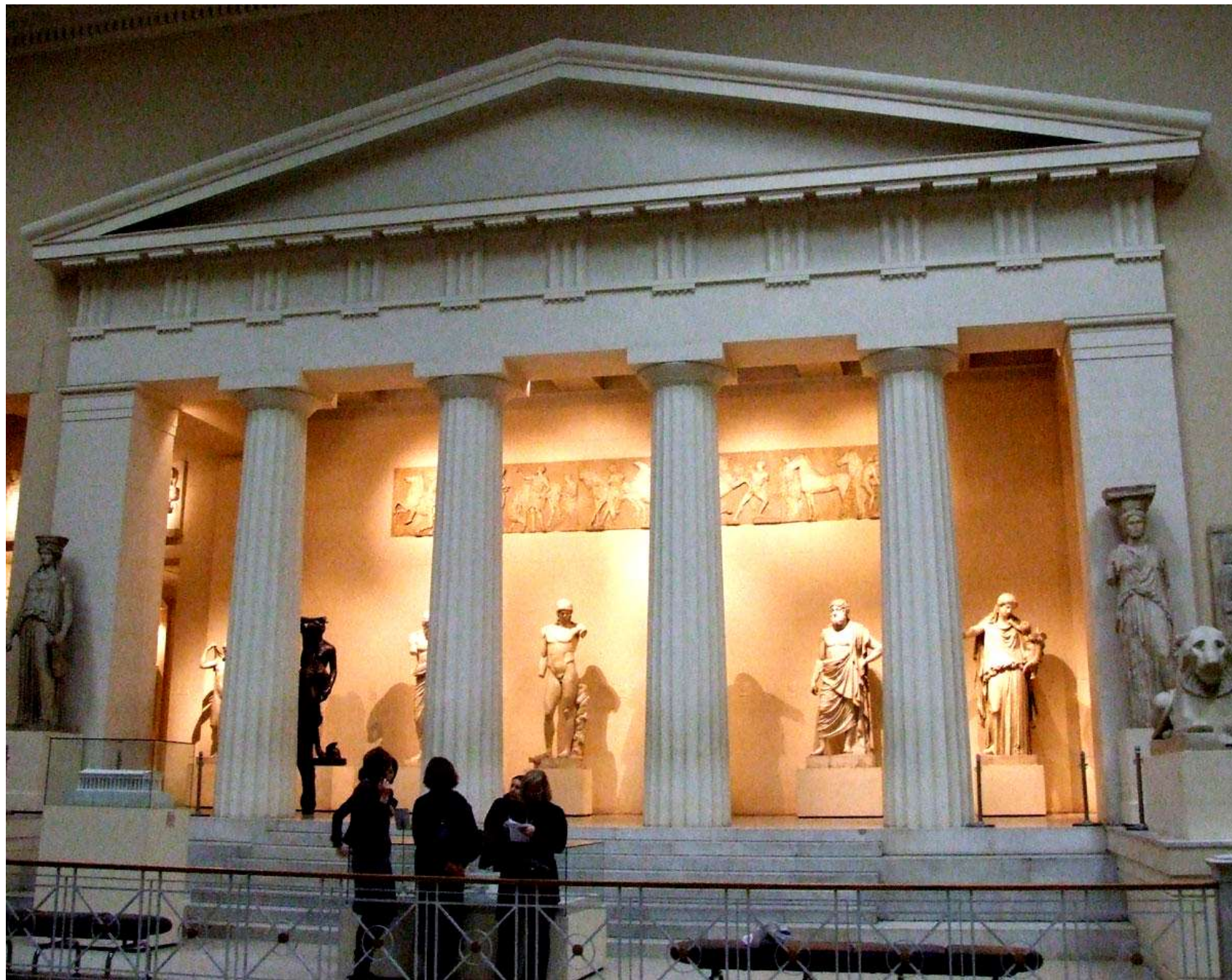
Гефестейон Между 440 и 430 гг. до н.э. Мрамор