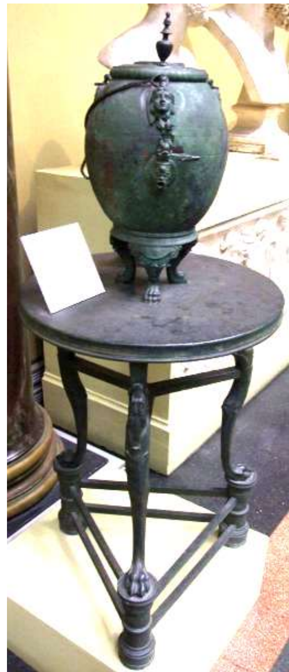
Сосуд для кипячения воды, стоящий на треножнике. Конец I в. до н.э. - начало I в. Бронза