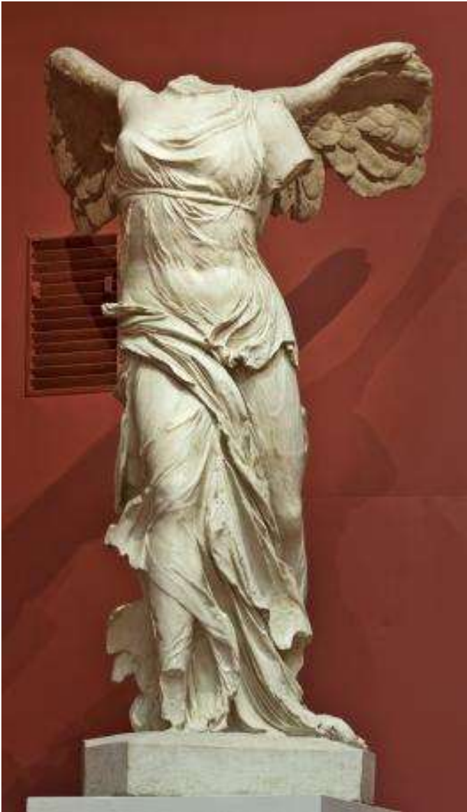
Ника Самофракийская Около 190 г. до н.э. Найдена на о. Самофракия в 1863 г. Мрамор