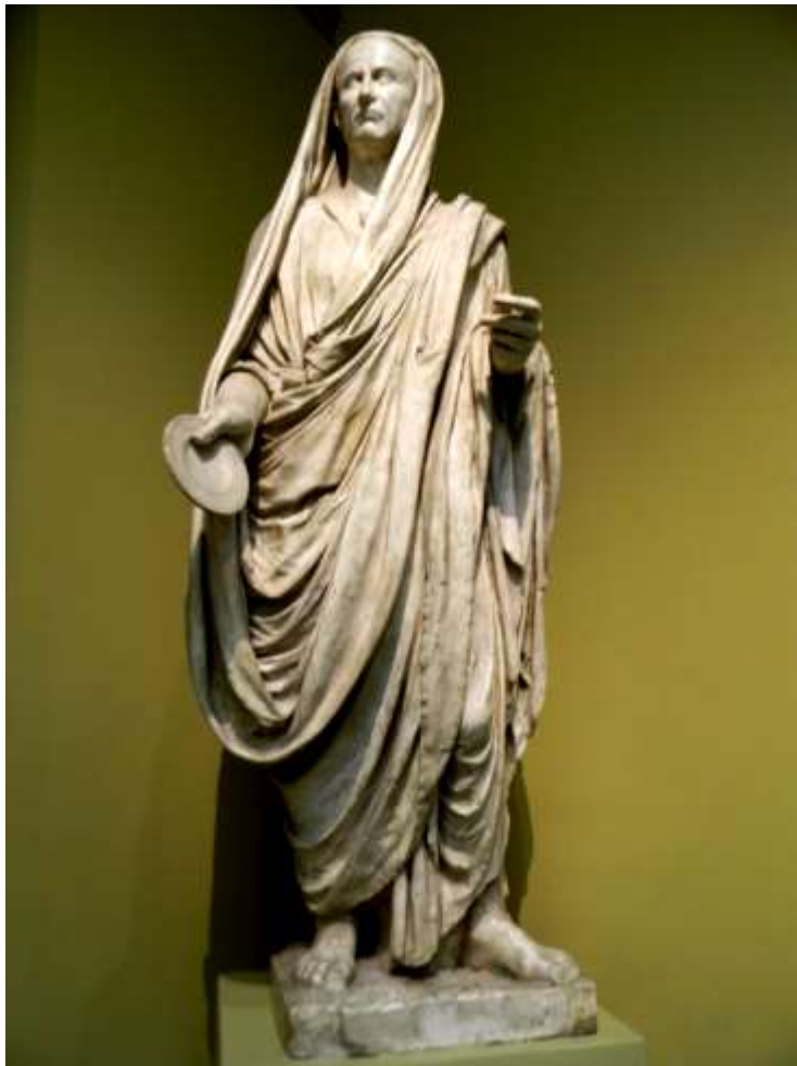
Статуя римлянина, совершающего возлияния I век до н.э. Мрамор