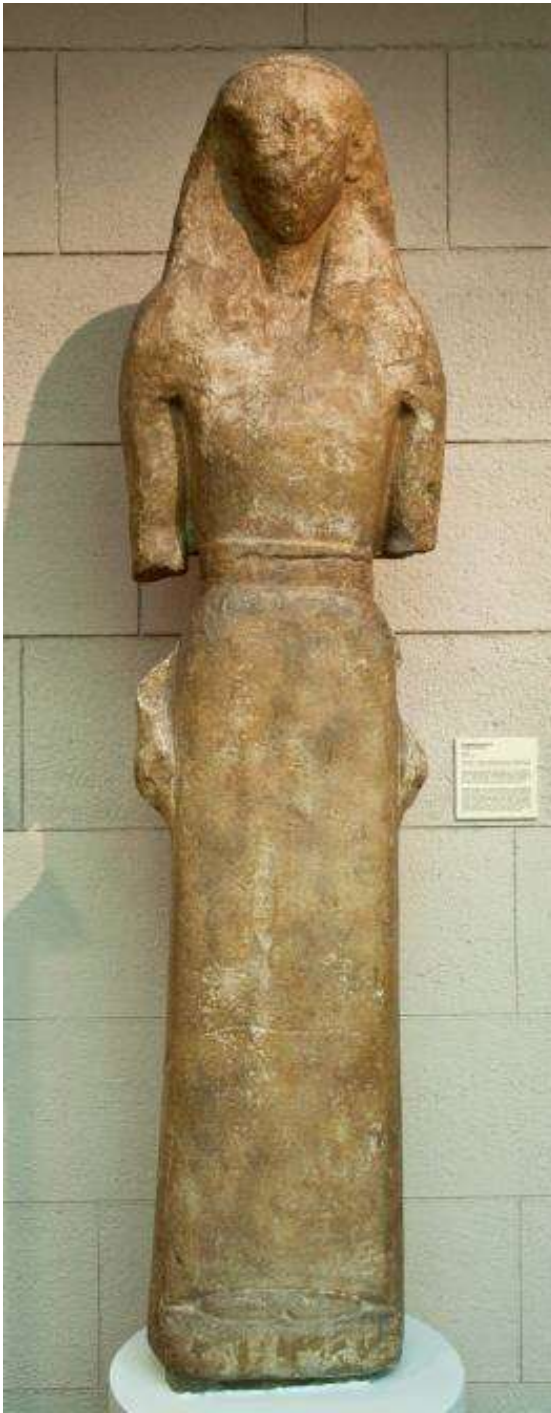
Артемида Делосская. Середина VII в. до н.э.; найдена на о. Делос. Мрамор