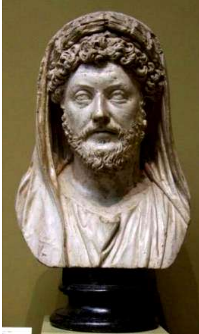
Портрет Марка Аврелия (121-180 гг.) 70-80 гг. II в. Мрамор