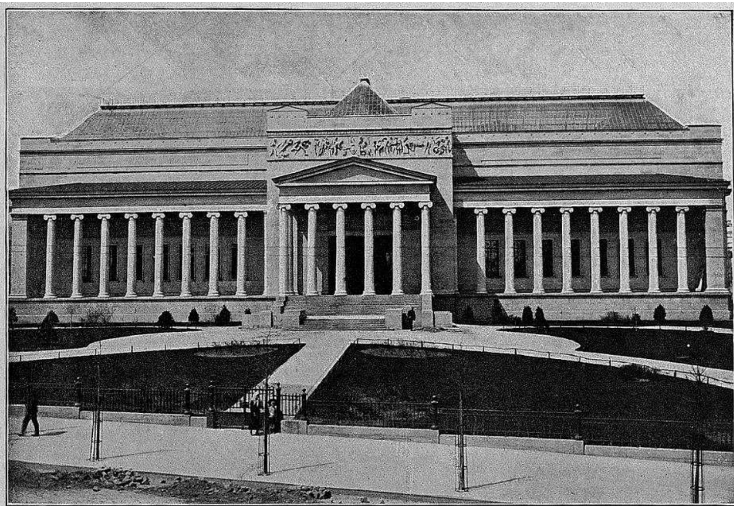
Музей Императора Александра III.

Музей изобразительных искусств был открыт в 1912 году и назывался Музеем изящных искусств имени императора Александра III