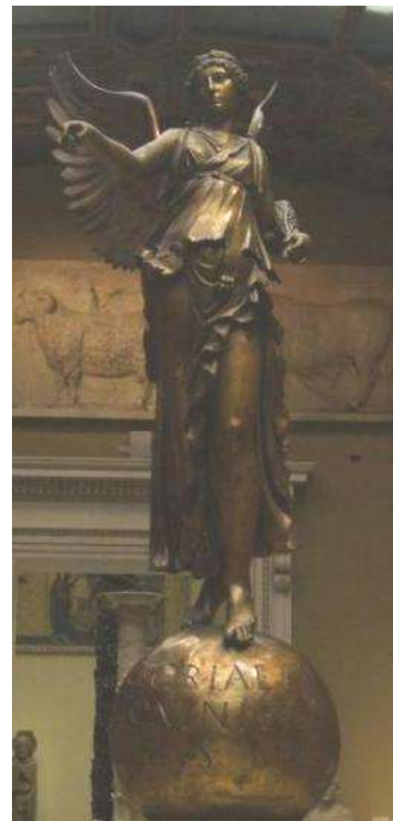
Виктория. Вторая половина II в. (ок. 168 г. н.э.). золоченная бронза