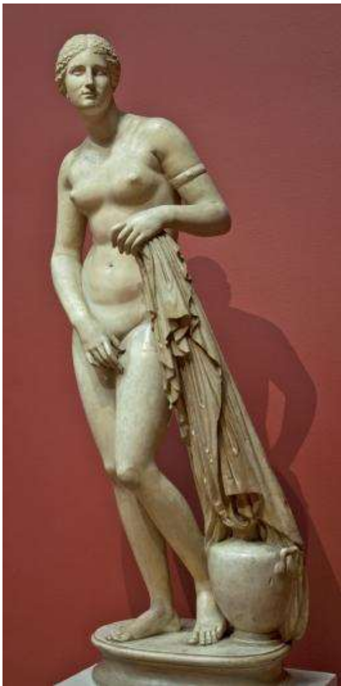
Пракситель. Афродита Книдская . Копия римского времени с греческого оригинала, ок. 350 г. до н.э. Мрамор