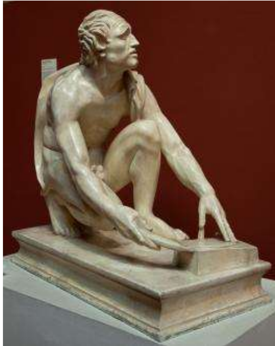
«Точильщик», раб-палач, готовящийся к казни Марсия. Копия римского времени статуи III- II вв. до н.э. Мрамор