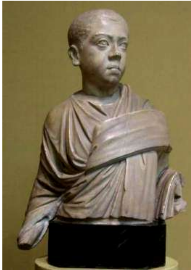
Портрет мальчика III в. Мрамор