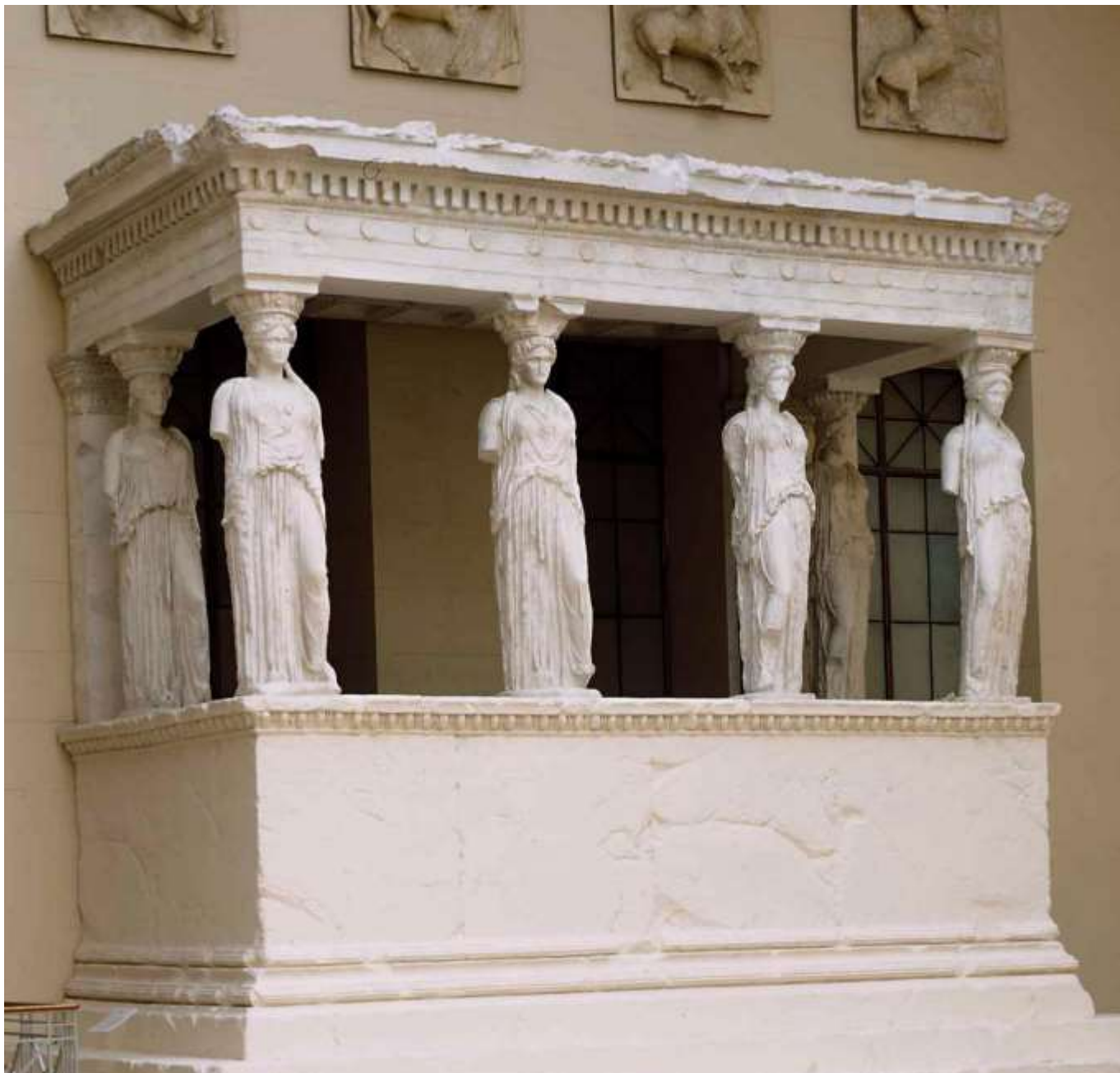
Южный портик храма Эрехтейон в натуральную величину. «Портик кариатид» 420 - 406 гг. до н.э. Мрамор