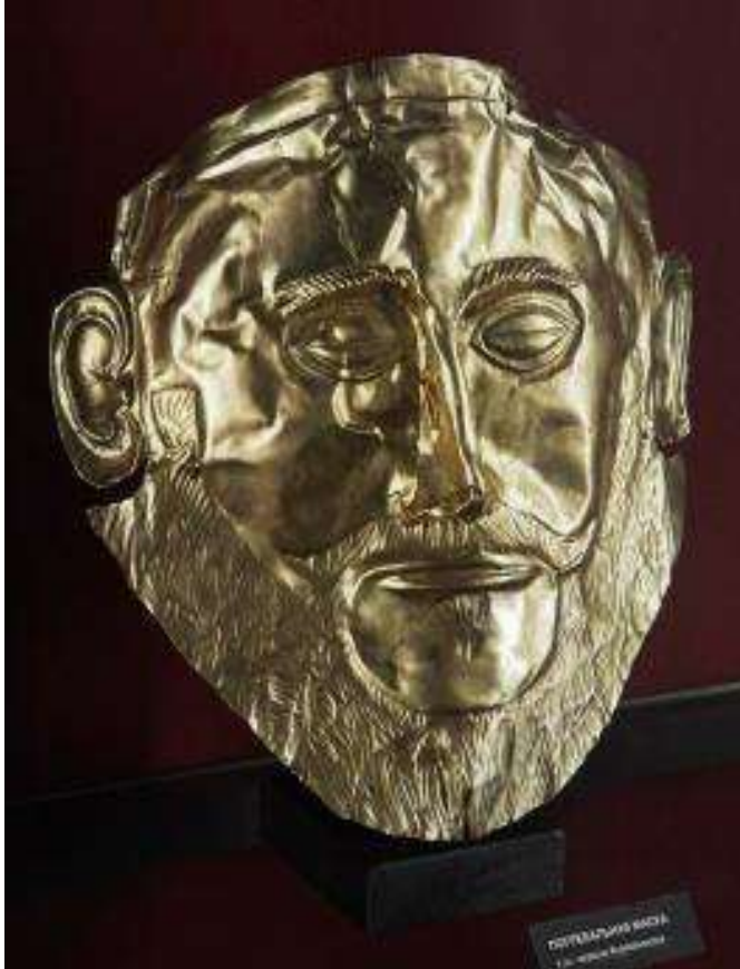
Погребальная маска, т.н. «маска Агамемнона» XVI в. до н. э. Золото, серебро