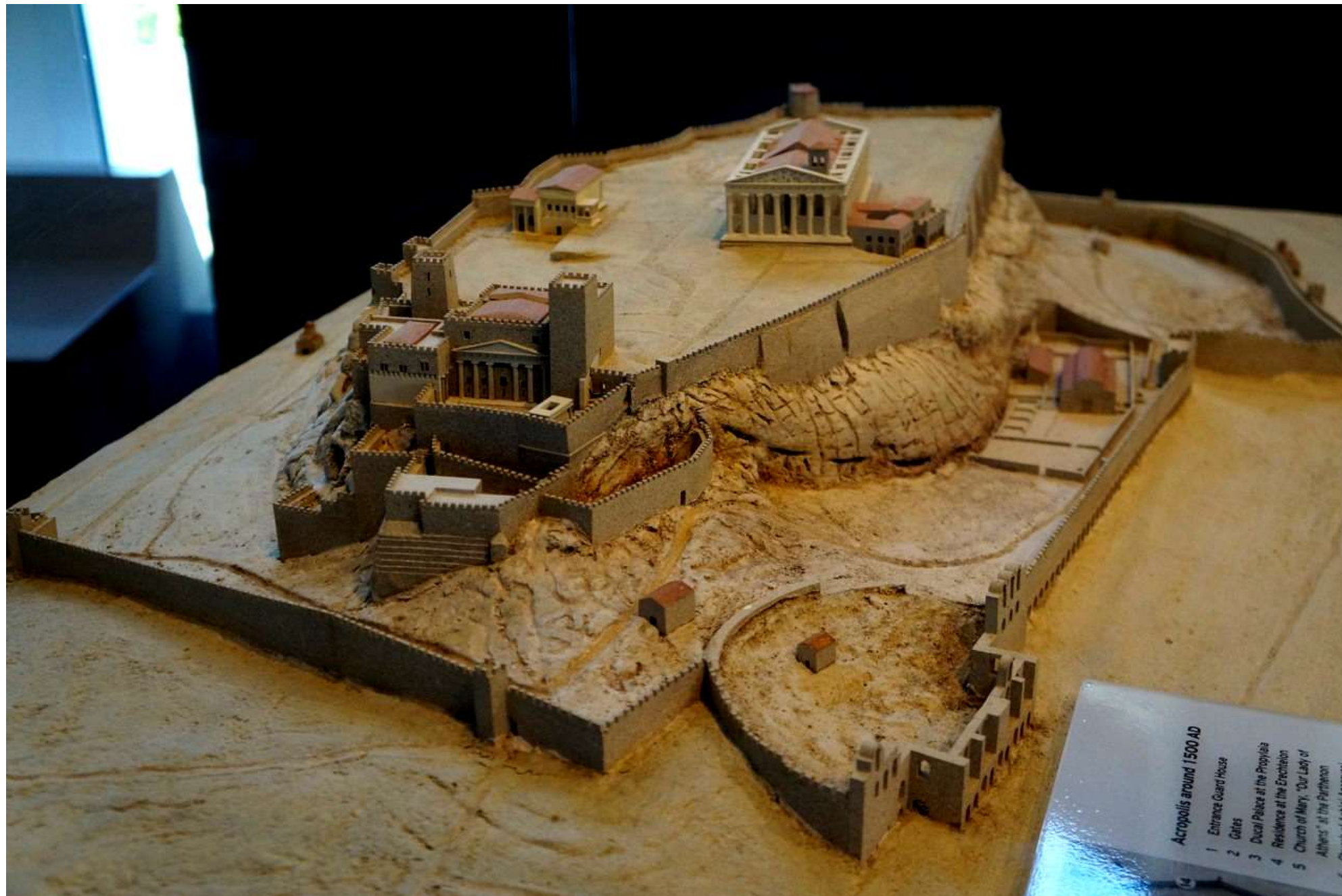
• Макет Афинского Акрополя