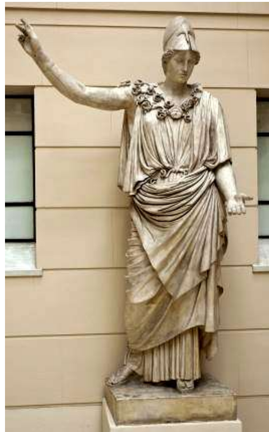
Афина из Веллетри. I в. н.э.