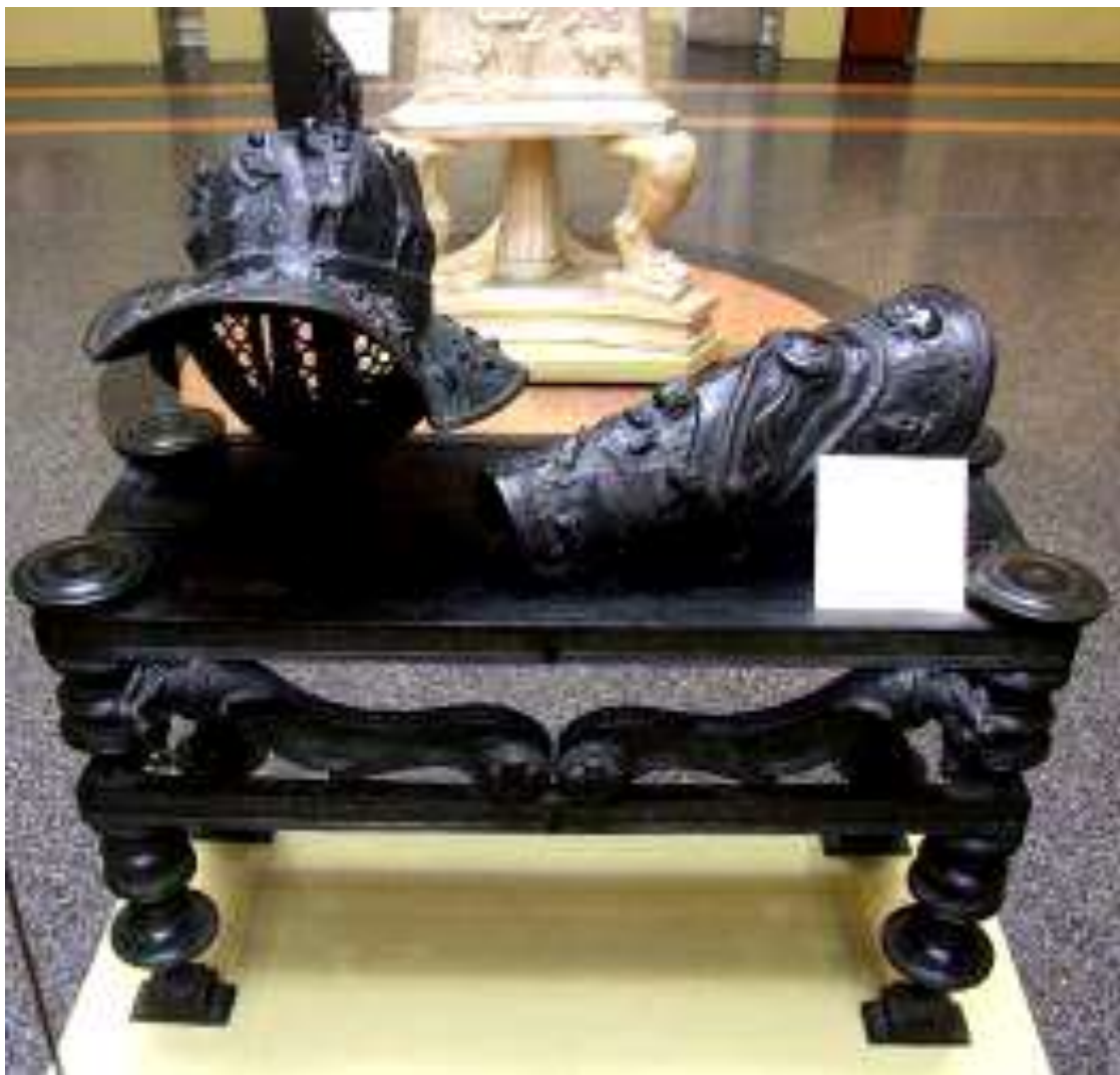
Шлем и поножь гладиатора на скамье . I в. до н.э. - I в. Бронза