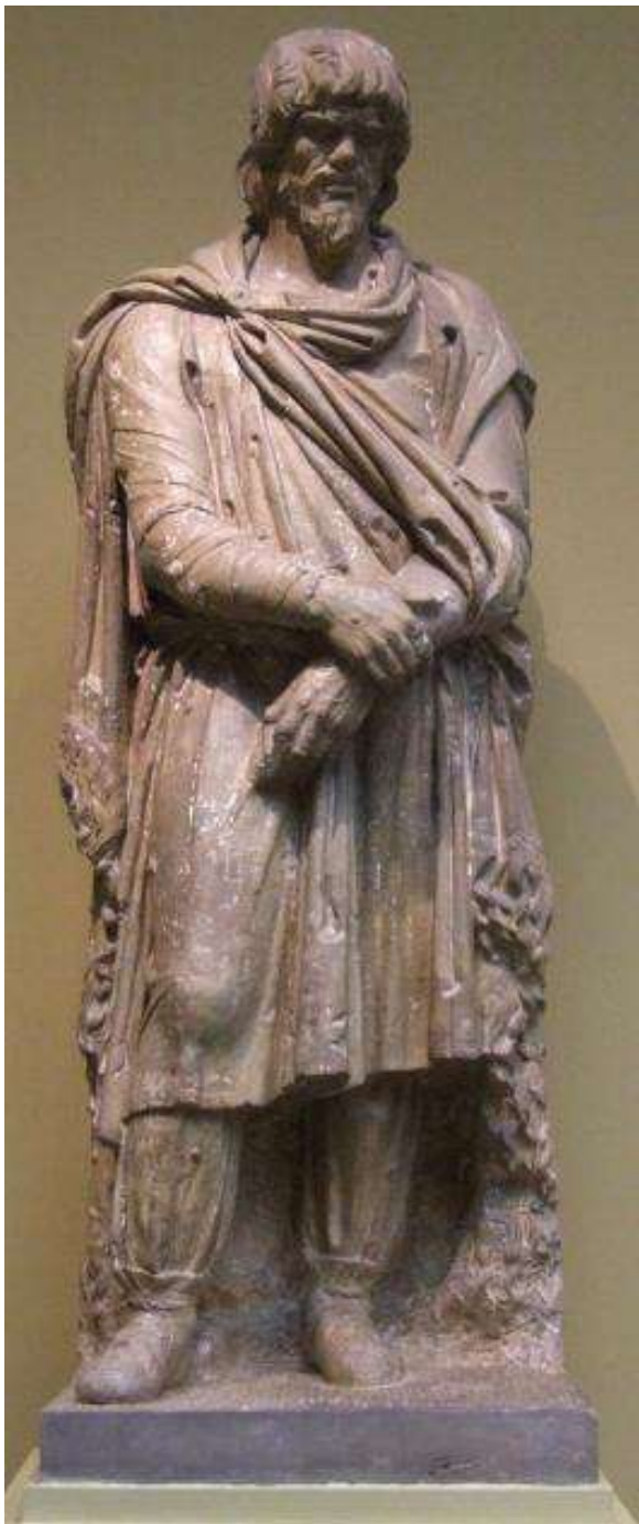
Пленный дак. Начало II в. Мрамор