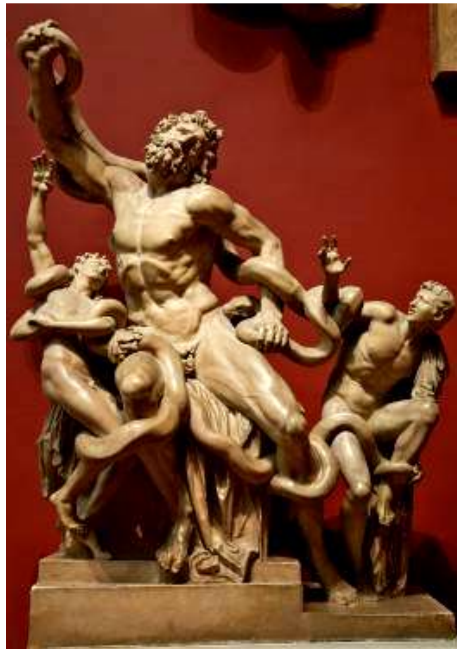
Группа Лаокоона Мрамор