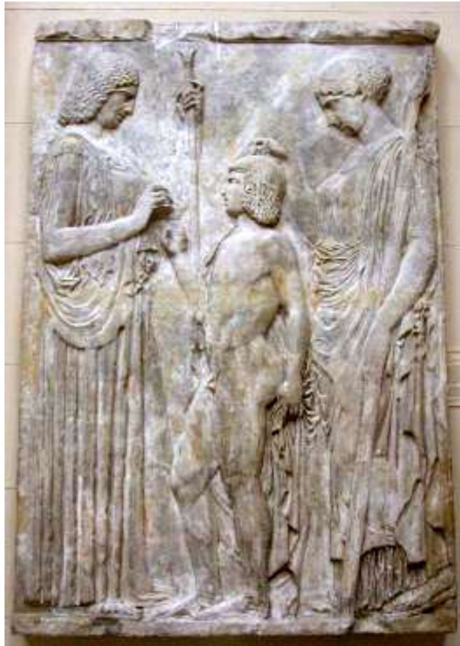
Рельеф с изображением Элевсинских богов Ок. 430 г. до н.э., найден в Элевсине