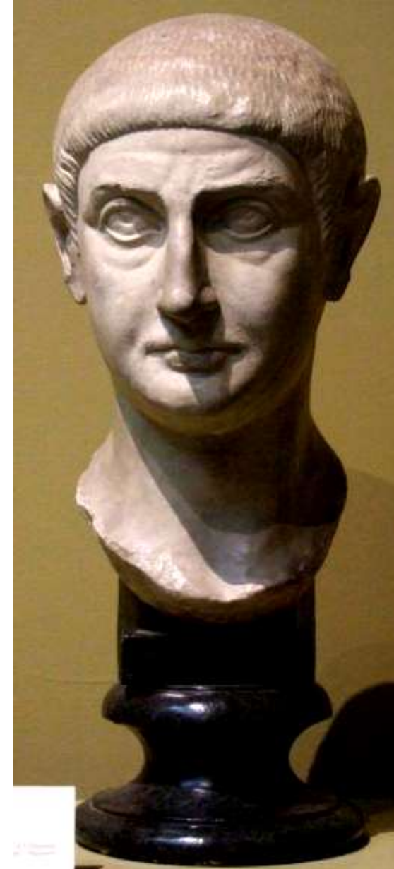
Портрет римлянина Начало IV в. . Мрамор