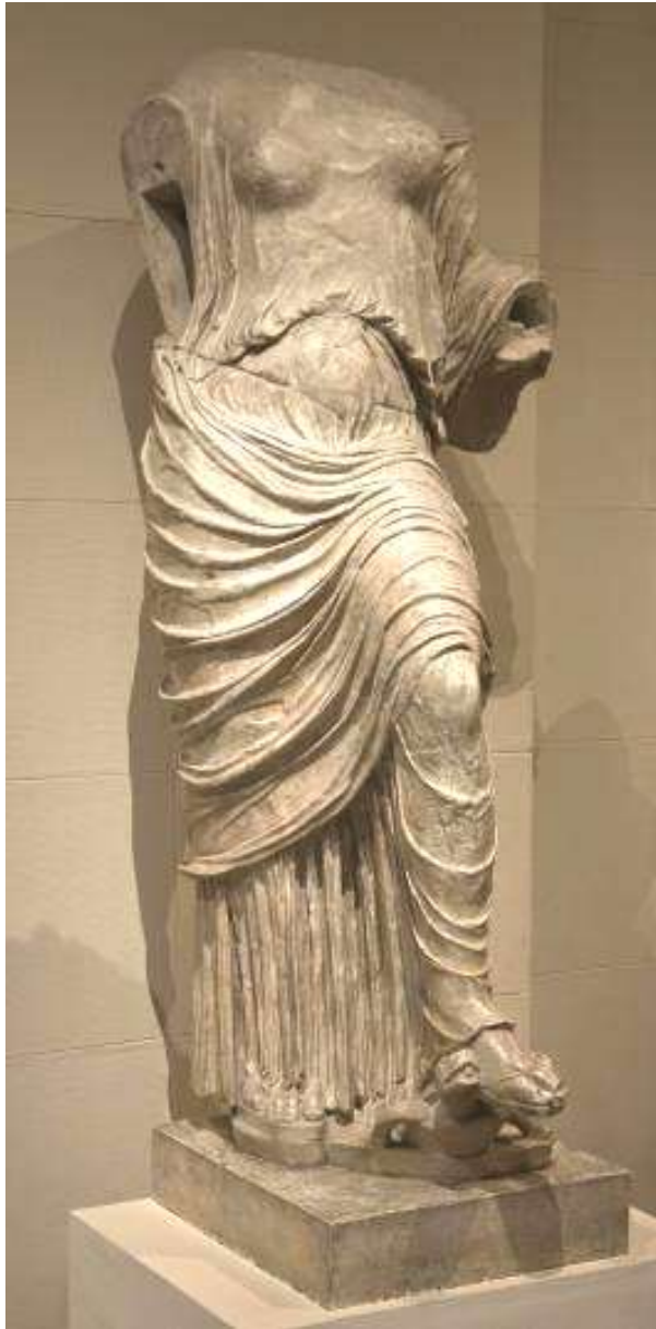
Афродита. Мраморная копия со статуи работы Фидия (?), ок. 430 г. до н.э. Мрамор