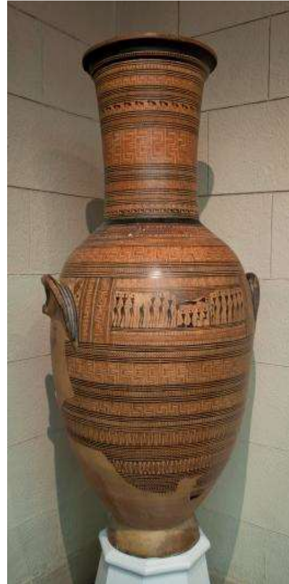
Погребальная амфора. Ок. 750 г. до н.э.; найдена в Афинах, у древних ворот города - "Дипилонских "