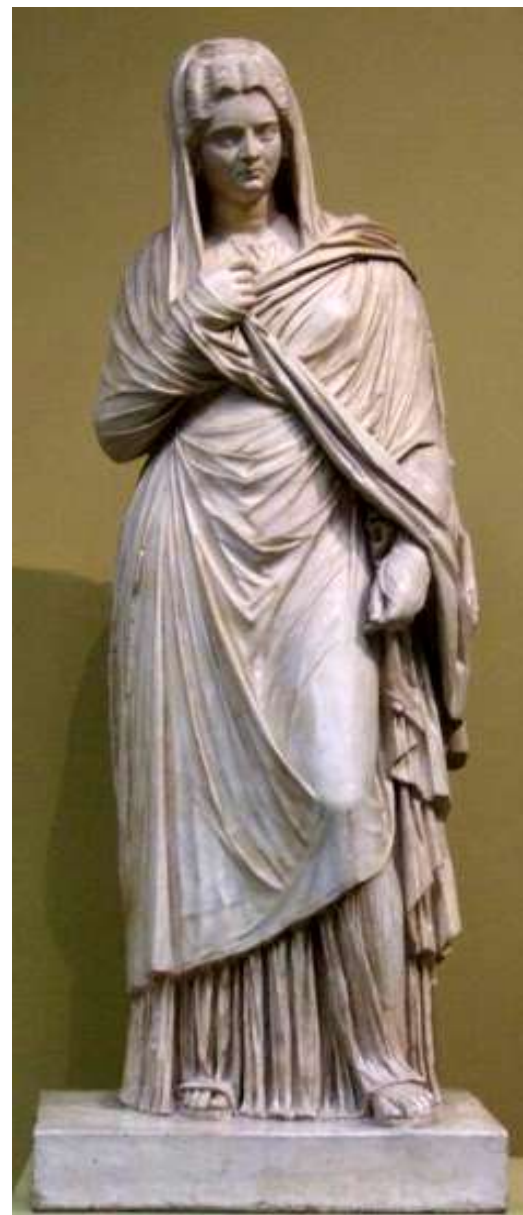
Геркуланьянка. Вторая половина IV в. до н.э. Мрамор