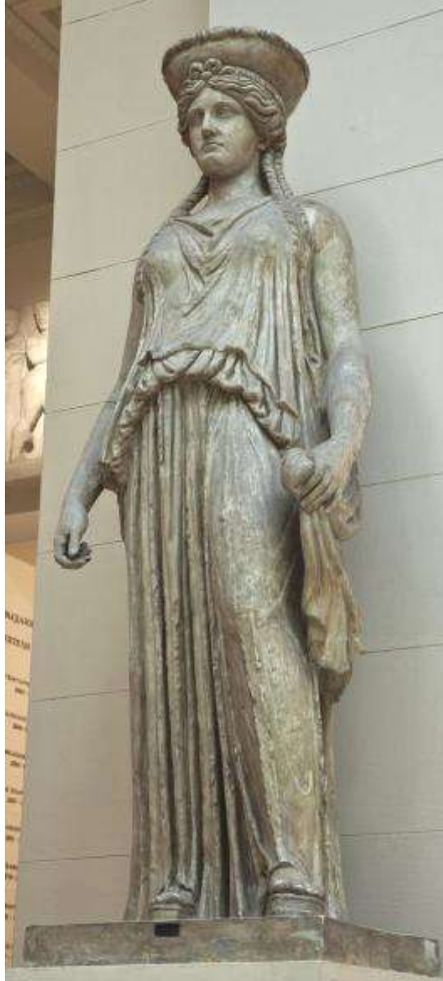
Кариатиды с портика Эрехтейона. Римская копия одной из кариатид портика Эрехтейона; 420- 406 гг. до н.э. Мрамор