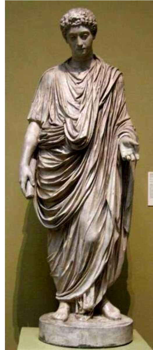
Портретная статуя Коммода. (161-192 гг.) Последняя четверть II в. Мрамор