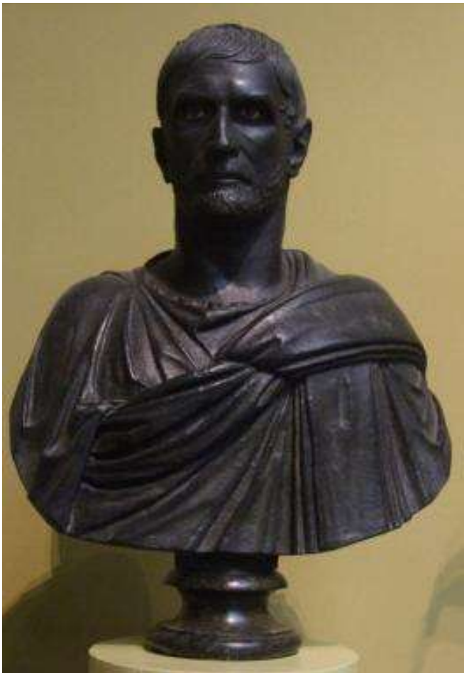
Портрет мужчины т.н. Брут . Конец III - начало II в. до н.э. Бронза