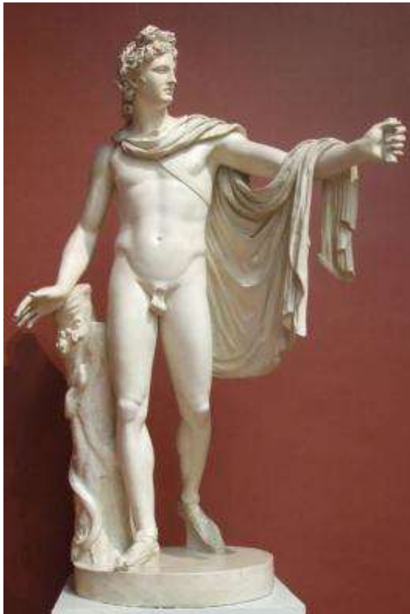
Леохар. Аполлон, т.н. Аполлон Бельведерский. Римская копия с греческого оригинала ок. 330-320 гг. до н.э.; найдена в Италии в конце XV в. Мрамор