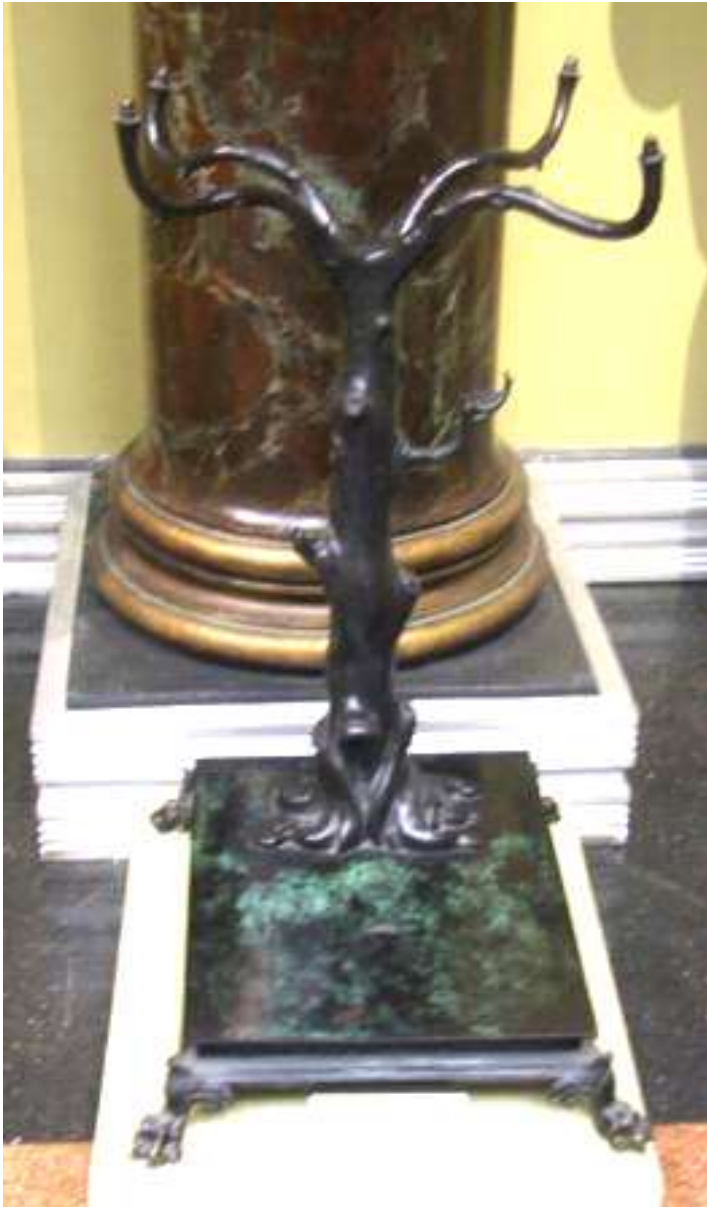
Канделябр Конец I в. до н.э. - начало I в. Бронза

Большое место в экспозиции зала занимают гальванопластические воспроизведения металлических изделий, посуды и утвари.