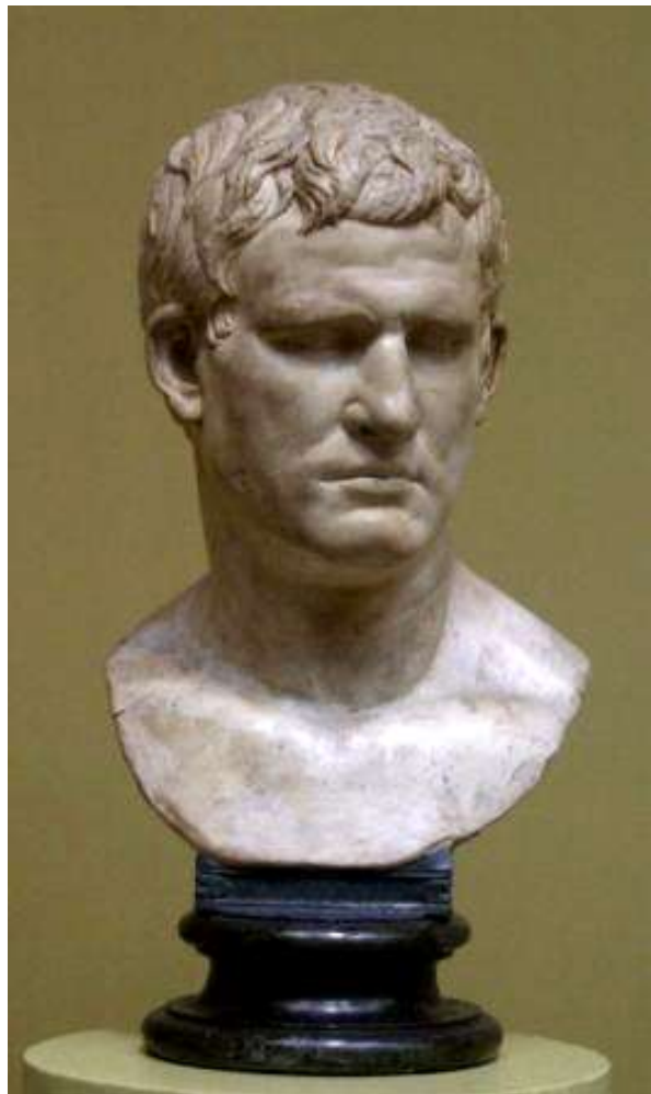
Портрет Марка Випсания Агриппы. Конец I в. до н.э.- начало I в. Мрамор

Специфической особенностью римского ваяния был портретный бюст.