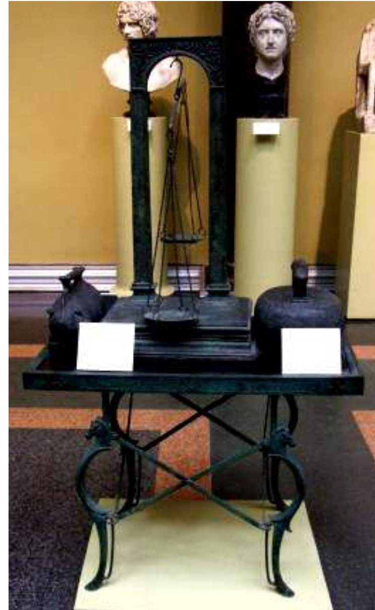
Весы и гири на столике I в. Бронза