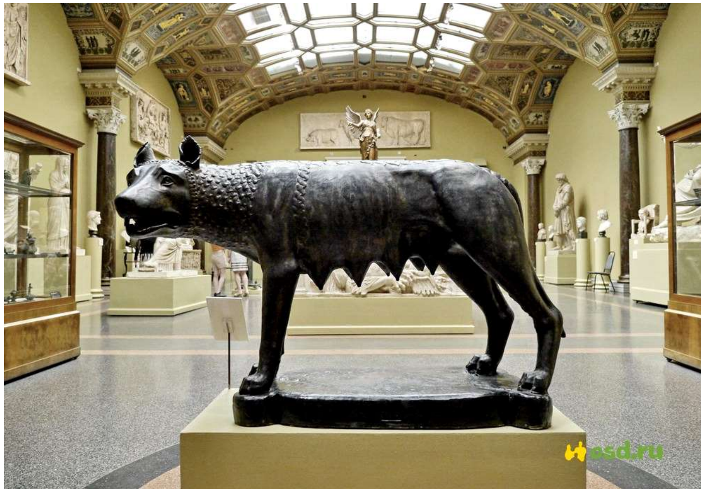
Капитолийская волчица . Вторая четверть V в. до н.э. Бронза

Этруски славились обработкой металлов – железа и особенно бронзы. Самые ранние скульптурные памятники, сохранившиеся на территории Рима, – произведения этруских литейщиков.