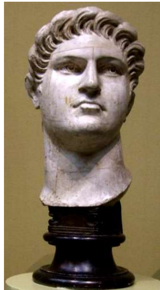
Портрет Нерона (37-68 гг.) I в. Мрамор