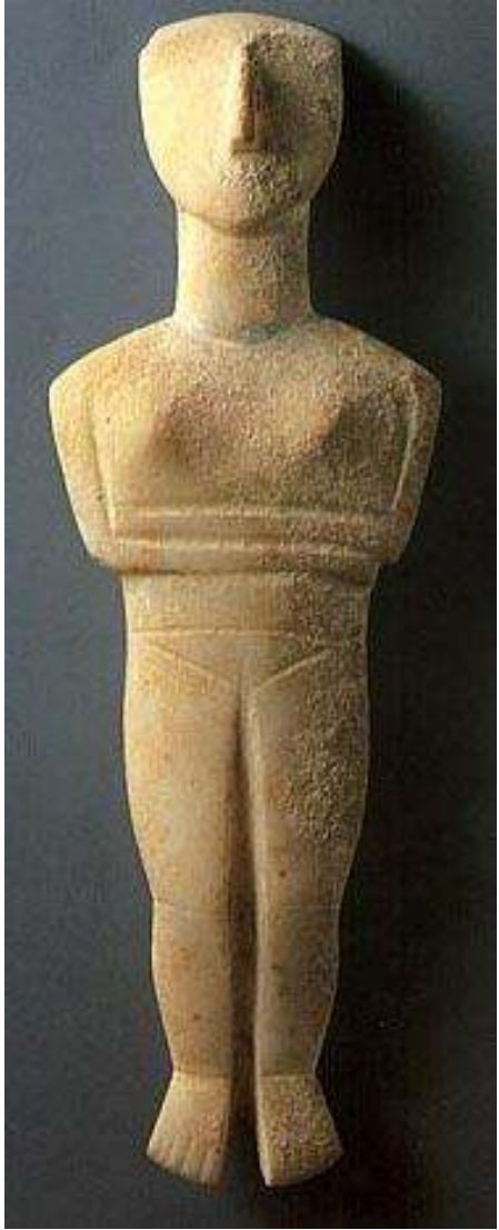
Фигурка женского божества т.н. «Кикладские идолы». III тыс. до н. э.