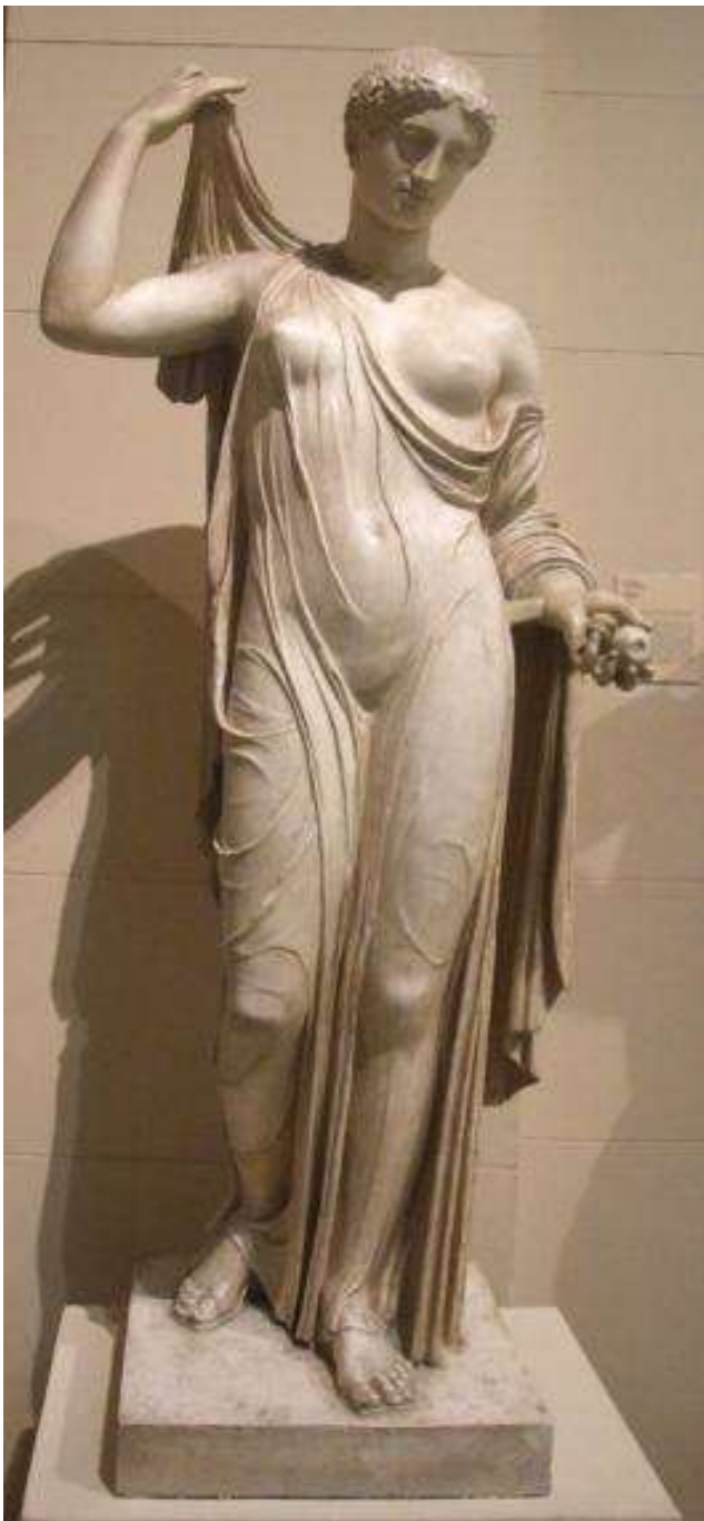
Каллимах Афродита в «садах». Римская копия с работы Каллимаха последней четверти V в. до н.э.