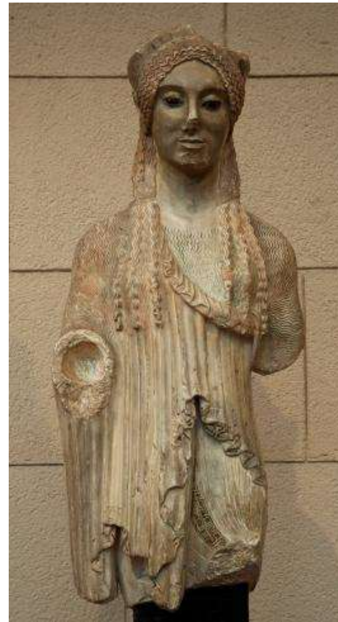
Кора с афинского Акрополя Около 500 г. до н.э. Мрамор