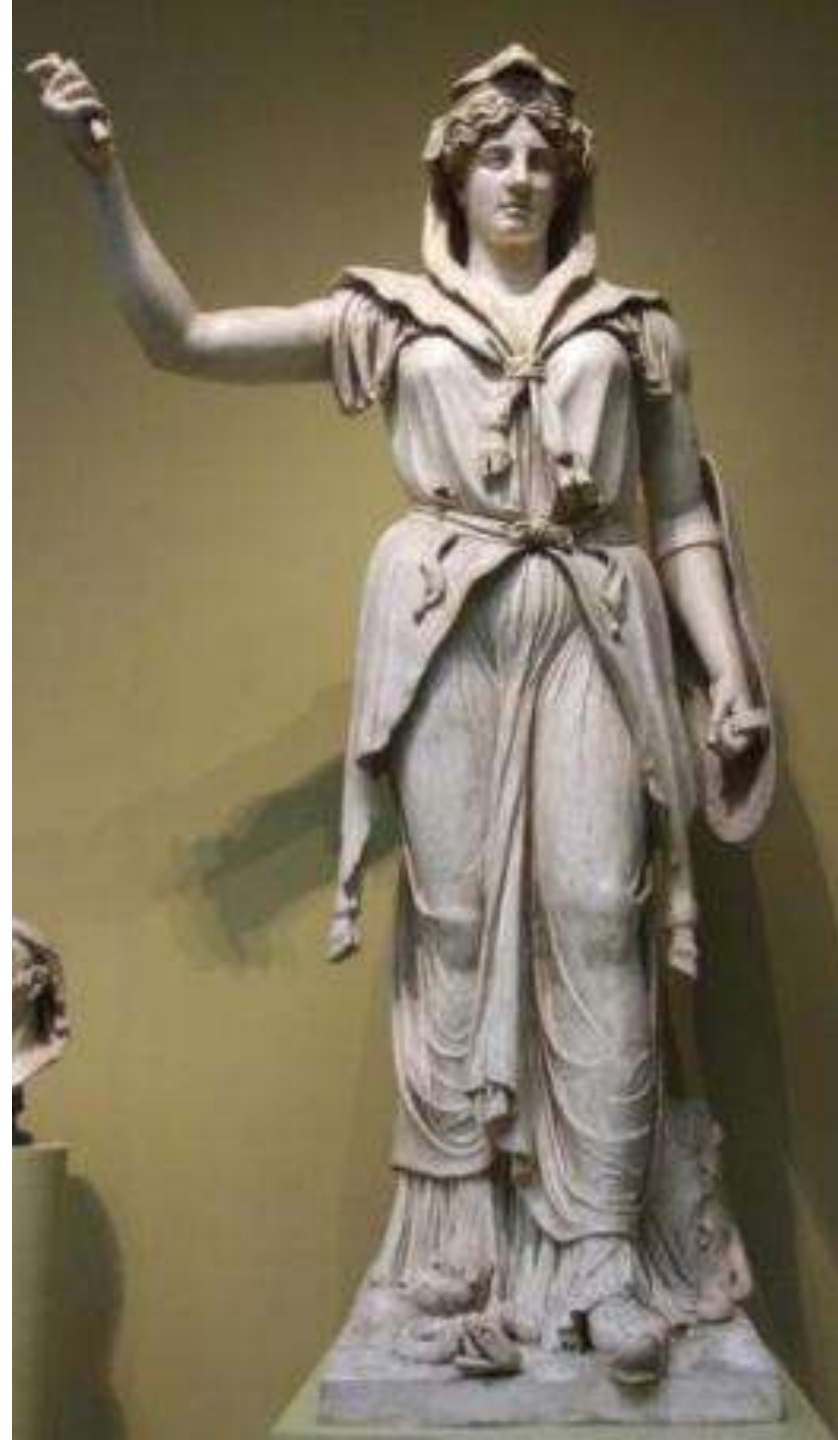
Юнона Соспита. Вторая половина II в. Мрамор

Изображение Нила находилось перед храмом Сераписа и Исида в Риме.