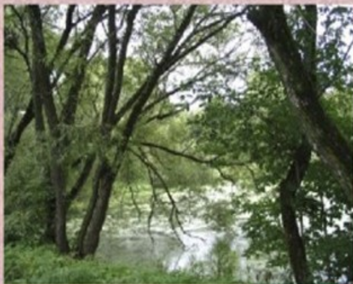
В парках города много старинных прудов