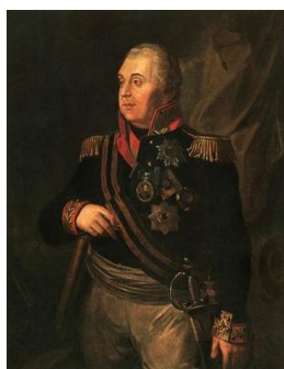
Пётр Александрович Румянцев (1713-1790)