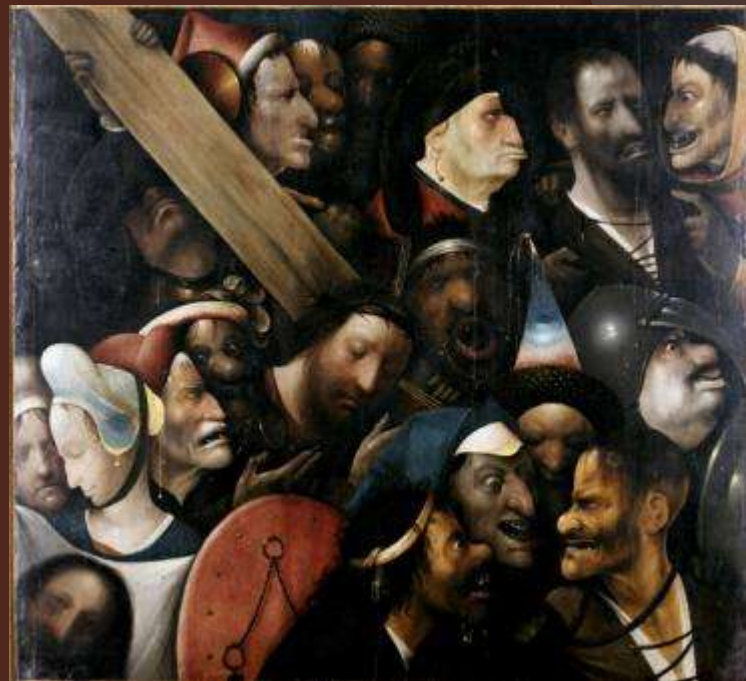
И. Босх «Несение креста», 1500-1516 гг.