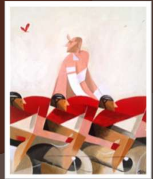
Рикардо Гуаско (Riccardo Guasco), современный итальянский график, род. в 1975 г.