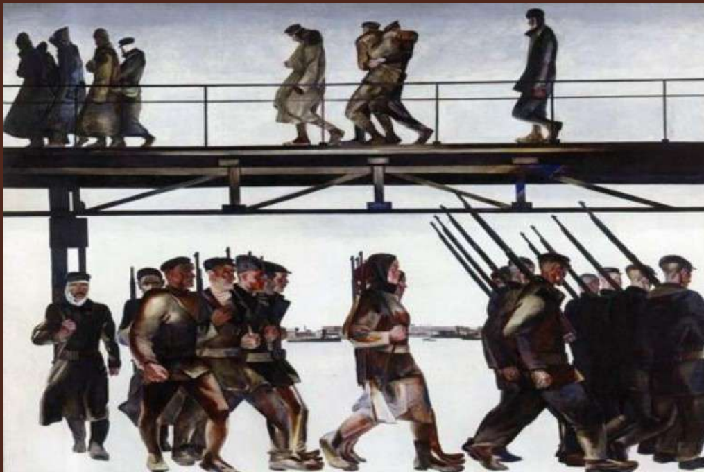
А.А. Дейнека «Оборона Петрограда», 1956 г.