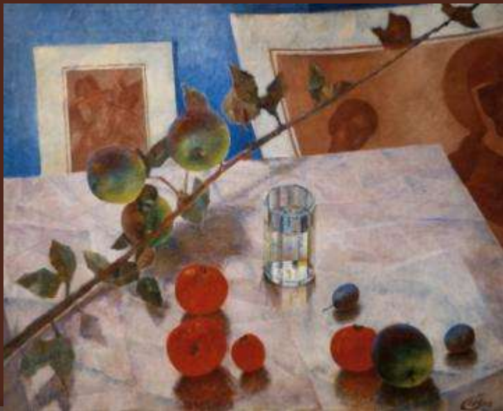
К. Петров-Водкин «Розовый натюрморт»

Пластическими модулями в станковой композиции могут быть любые объекты живой и неживой природы. Модули могут быть реалистичными, стилизованными, схематичными, в виде плоских или объемных геометрических форм. Они могут применяться в одинаковых или разных размерах, цветах и вариациях форм, но всегда ритм построения композиции из них, ритм изменения размеров и направление «движения» в формате будут помогать художнику решать задачи воздействия на зрителя сюжетов изобразительных картин.