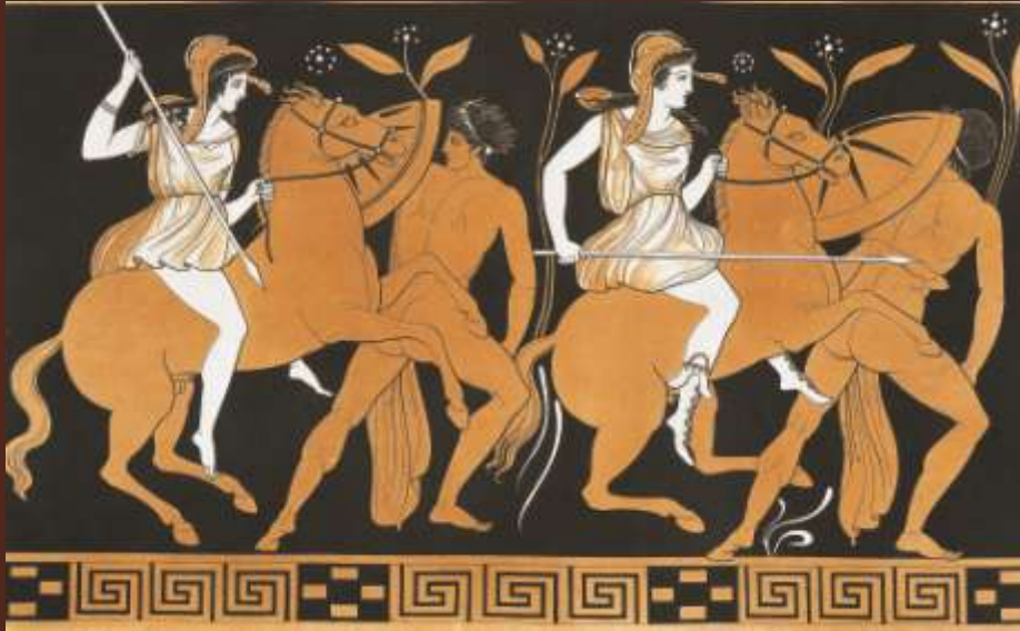
Вазопись краснофигурная. Античная Греция, конец VI в. до н.э.