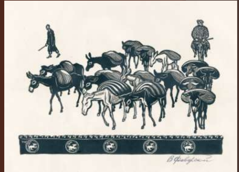
В. Фаворский, линогравюра, XX в.