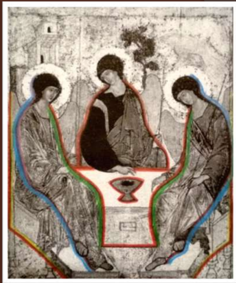
А.Рублев, икона Святой Троицы, XV в.