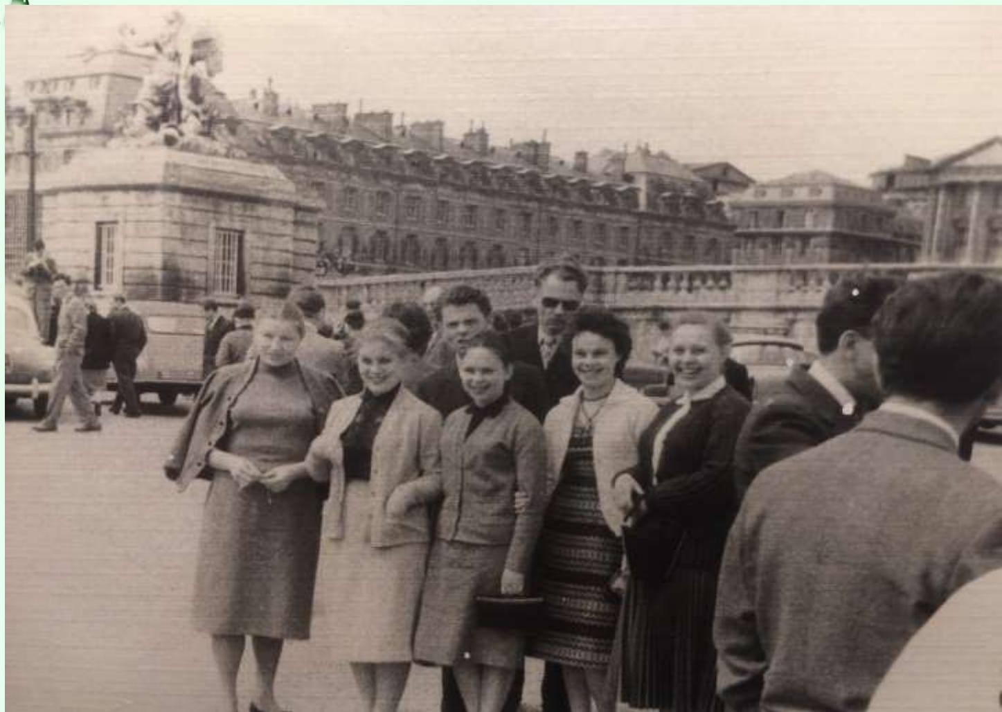
В 1957 Всесоюзный конкурс на VI Всемирном фестивале молодежи и студентов в Москве