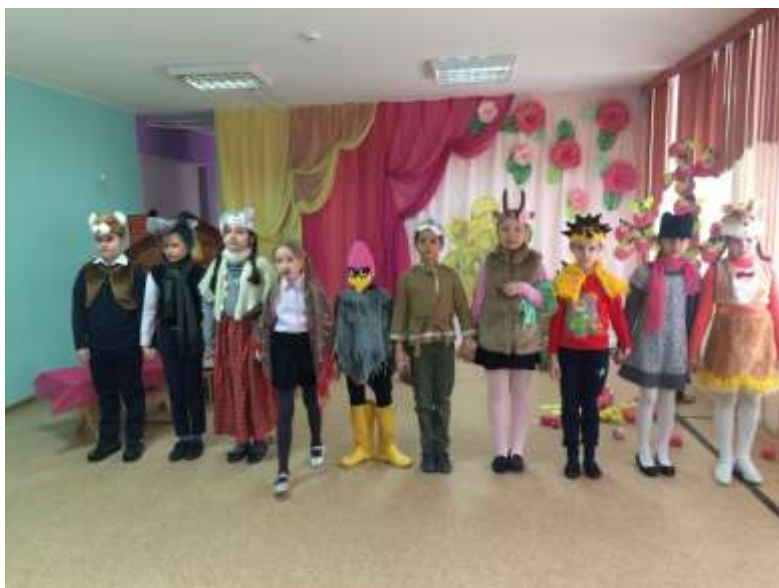
Спектакль «Мешок яблок» В. Сутеева. Представление в ЦГПВМ Г. Гаджиево