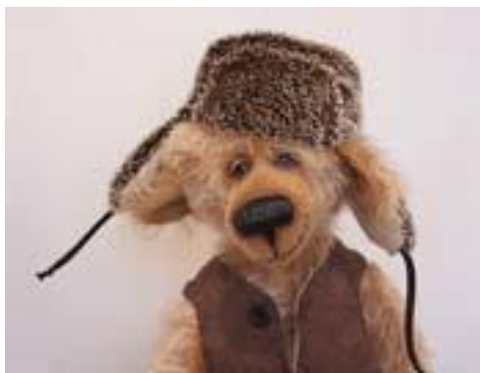
СИМВОЛ РУССКОГО ХАРАКТЕРА