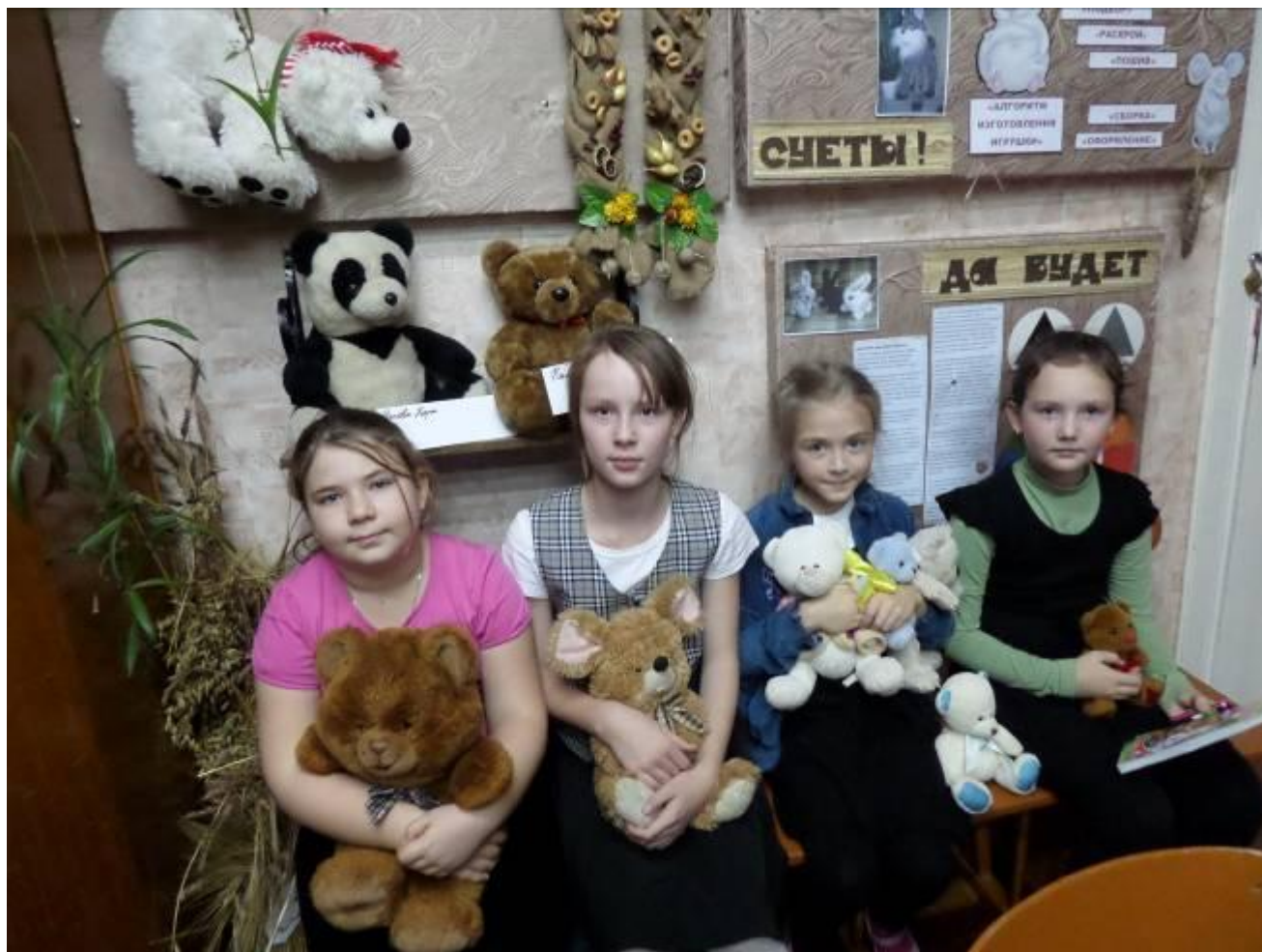
ВЫСТАВКА «ДОМАШНИХ МЕДВЕДЕЙ»