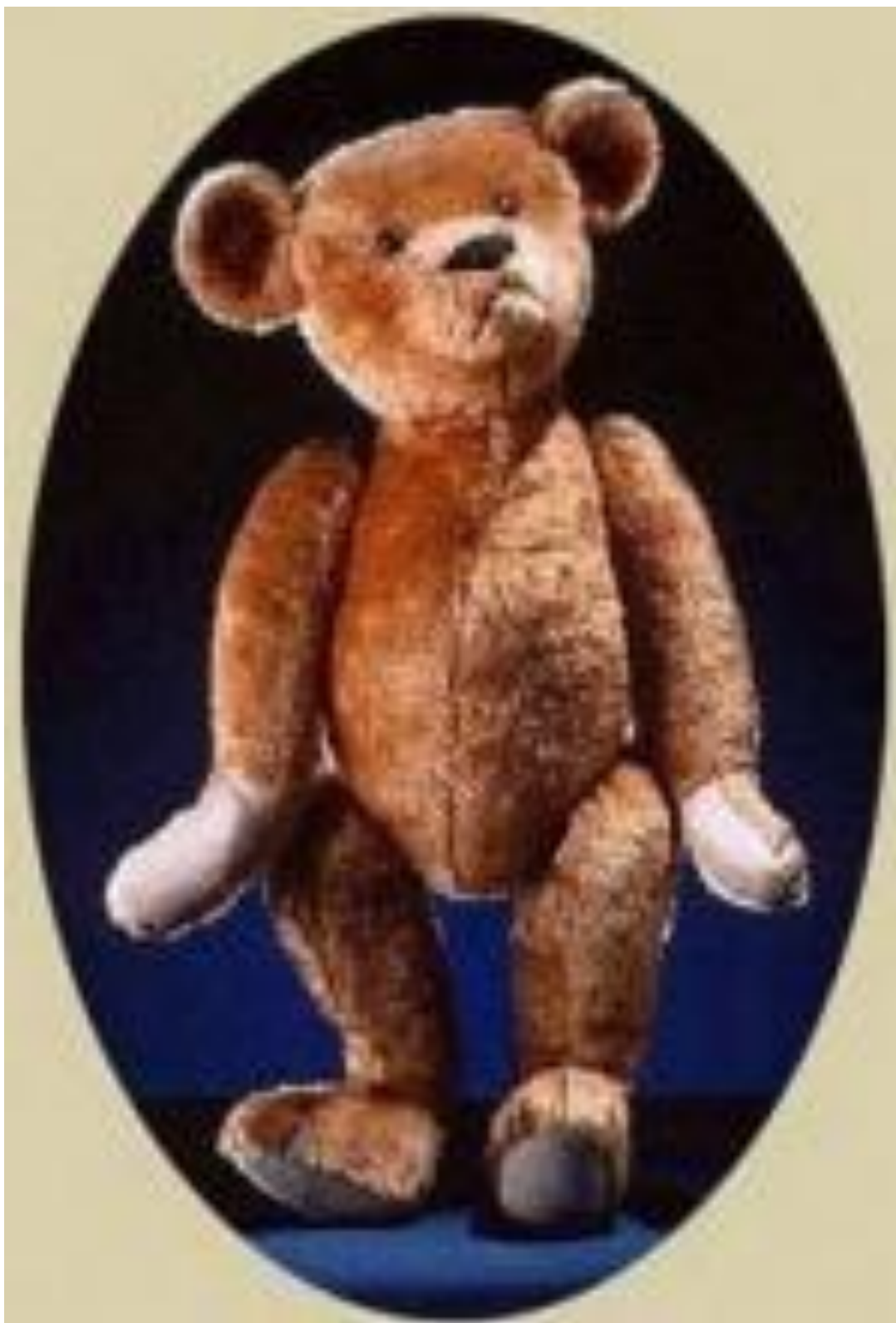
ТИП 55 ПП (55 дюймовый подвижный плюшевый)